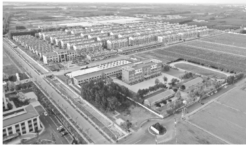
现在的北杏社区尽美家园。