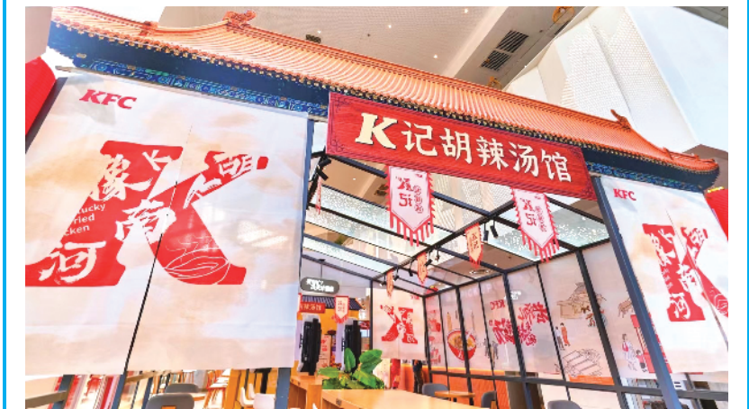
逍遥镇胡辣汤进入肯德基菜单

9月16日,肯德基利用西华逍遥镇胡辣汤非遗制作技艺,推出“肯德基胡辣汤”菜单,并率先在河南省内限定上市,受到广大市民的热烈追捧和一致好评。