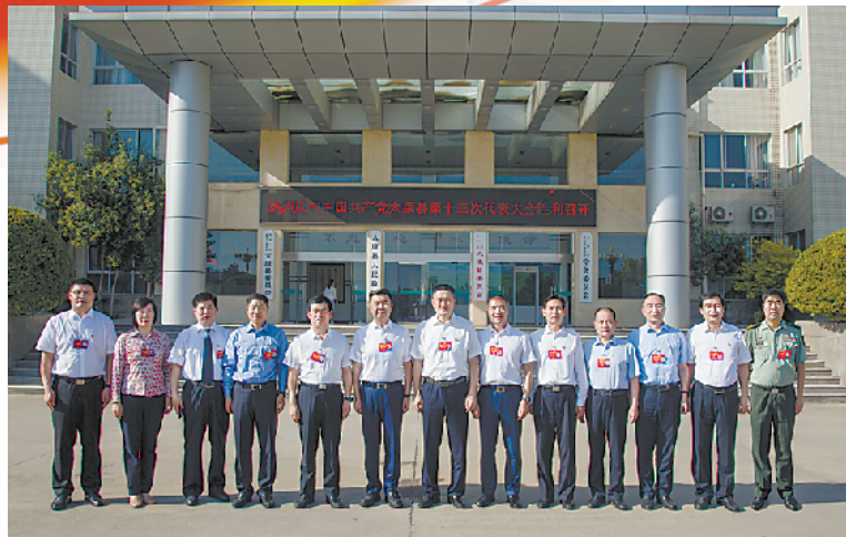
团结奋进的十三届太康县委领导班子