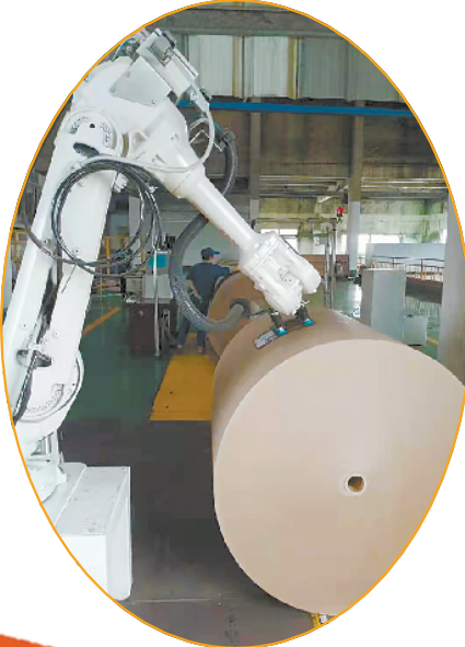
龙源纸业智能化车间一角

持续深化农村改革。规范发展农民专业合作社、家庭农场、种粮大户等新型经营主体，加强专业技术人才队伍建设和新型农民培训。改善农村生产生活条件，推动城镇基础设施和公共服务设施向农村延伸。