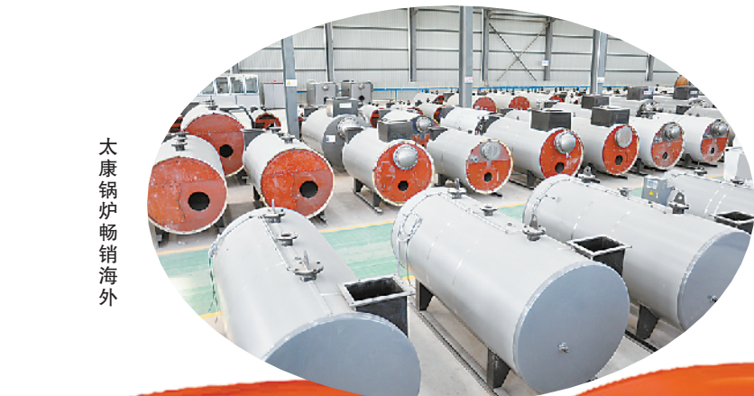
太康锅炉畅销海外