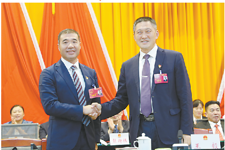
太康县委书记王毅祝贺张峰全票当选县长