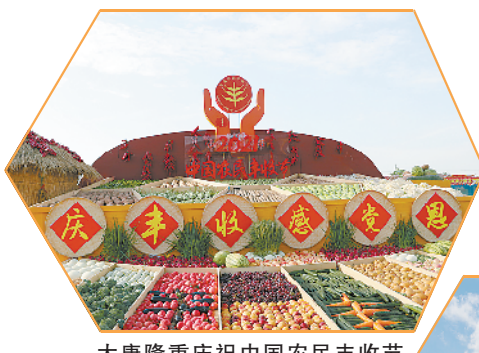
太康隆重庆祝中国农民丰收节