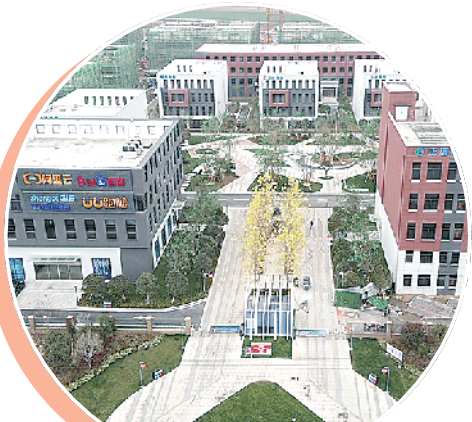
中兴新业港打造数字经济产业示范园