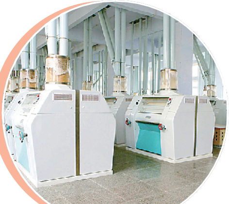
五得利面粉自动化生产线扩能提质