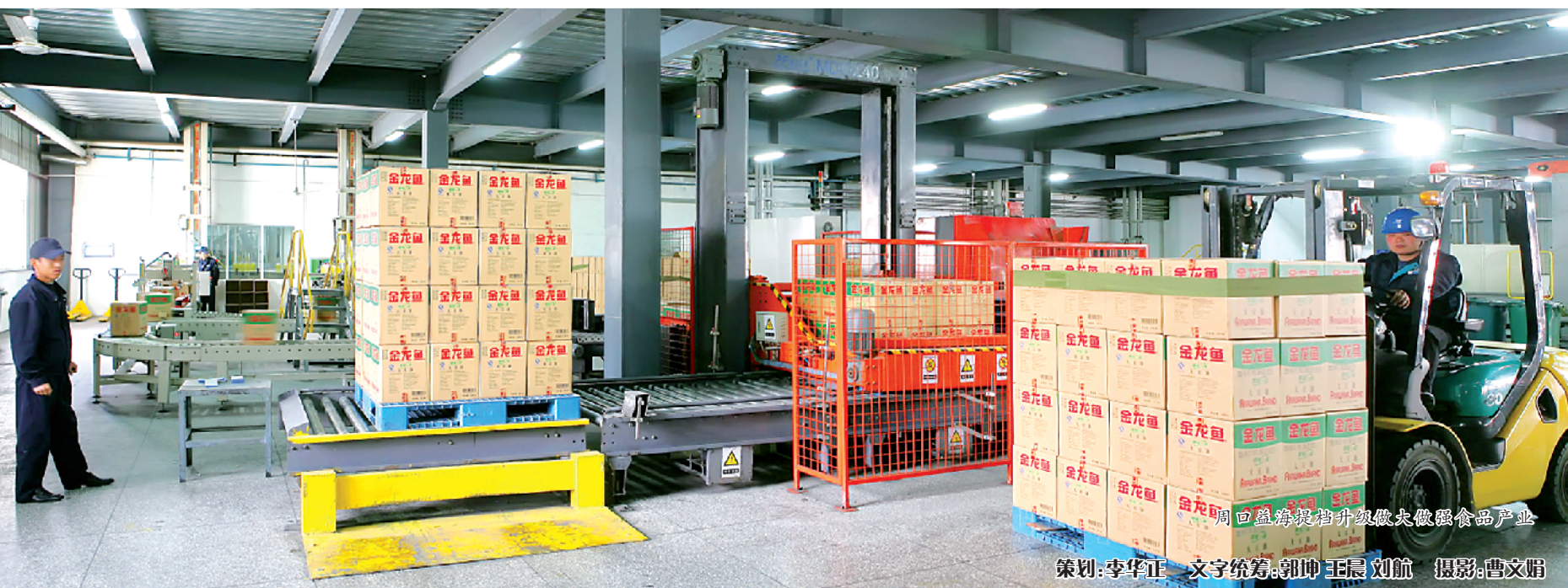
同益粉投升级做大做强食品产业 策划：李华正 文字统筹：郭坤 王晨 刘航