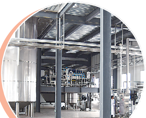
河南益常青生物科技有限公司技术领先