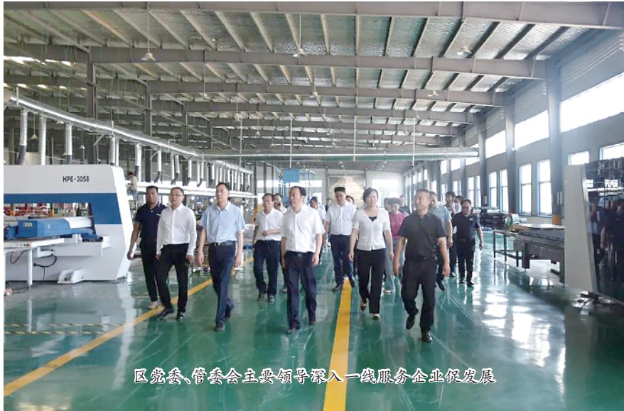
区党委、管委会主要领导深入一线服务企业促发展