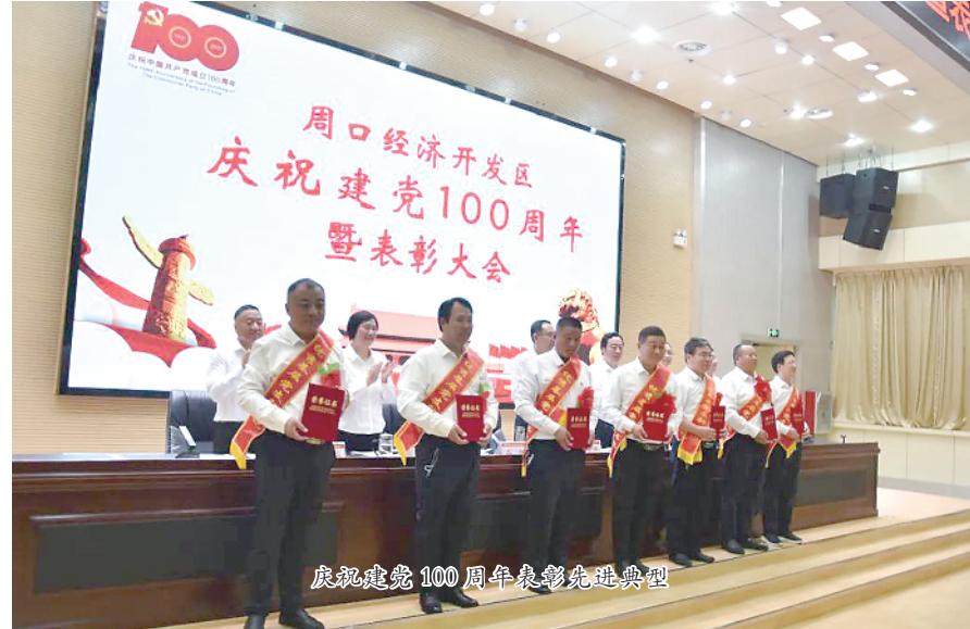
庆祝建党100周年表彰先进典型

今年是中国共产党成立100周年，是实施“十四五”规划、全面建设社会主义现代化国家新征程的开局之年，也是全市营商环境提升年和开发区加快转型迈出高质量发展步伐的关键之年，开发区党委、管委会全面贯