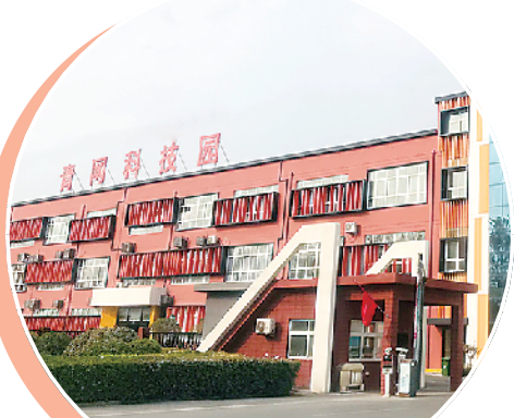
青网科技园专注打造互联网产业新高地