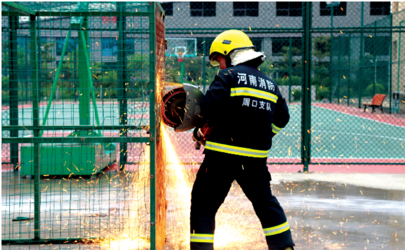
消防救援工作人员坚守岗位，全力确保消防安全。