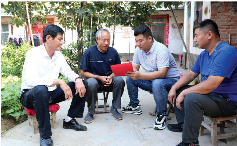
驻村第一书记、乡村干部与村民共度国庆。