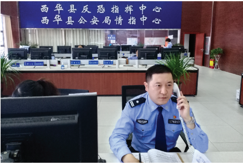
公安民警坚守岗位，为城市治安保驾护航。