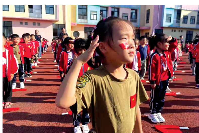
国庆节前夕，西华县坞城实验幼儿园开展了以“小小坞城娃，浓浓爱国情”为主题的国庆节庆祝活动，帮助儿童了解祖国，增强民族自豪感，萌发身为中国人的自豪感。