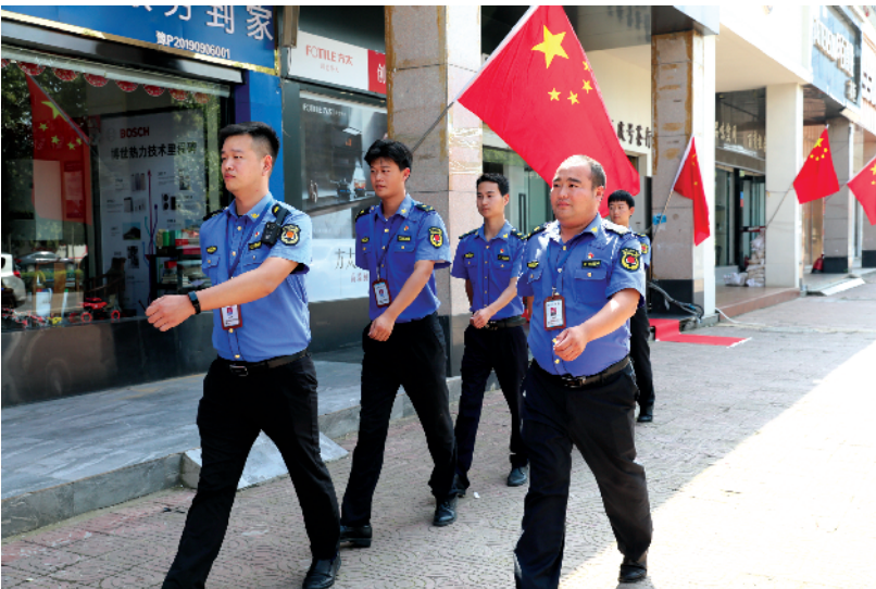
城管队员坚守一线，全力维护城市的市容市貌和秩序。