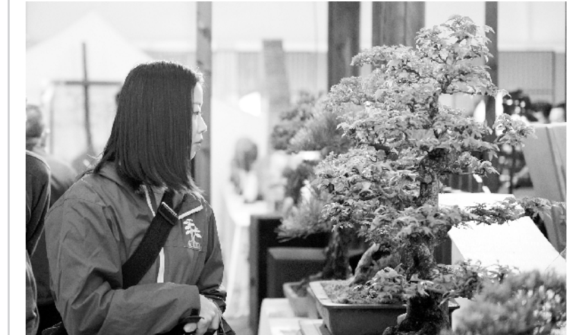
2021 年湖南省花木博览会开幕

10月15日，观众在博览会现场参观。当日，为期三天的2021年湖南省花木博览会在长沙市石燕湖景区开幕，设置室内展区、室外展区和花卉苗木基地展区。