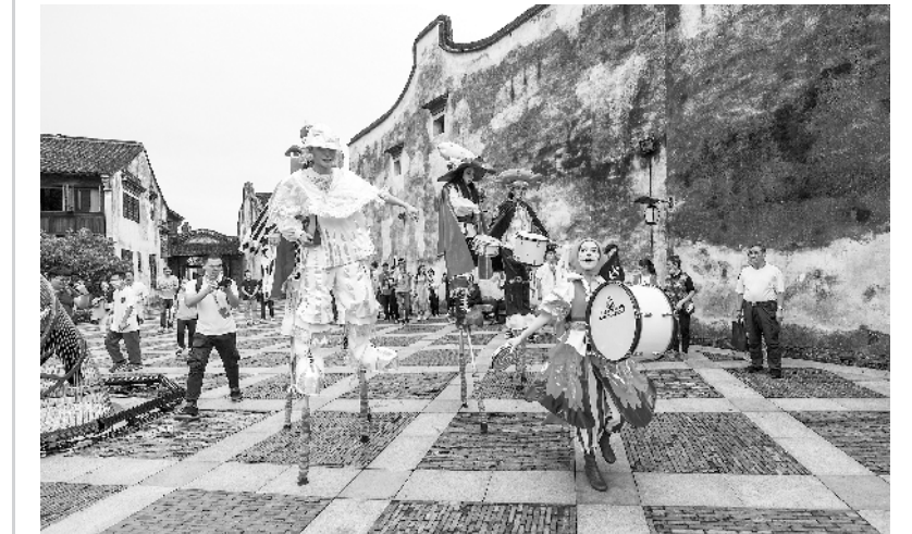
第八届乌镇戏剧节开幕

这是10月15日举行的古镇嘉年华“踩街”表演。当日，第八届乌镇戏剧节在浙江省桐乡市乌镇景区开幕。本届戏剧节以“茂”为主题，以特邀剧目、青年竞演、古镇嘉年华、小镇对话四个单元呈现。