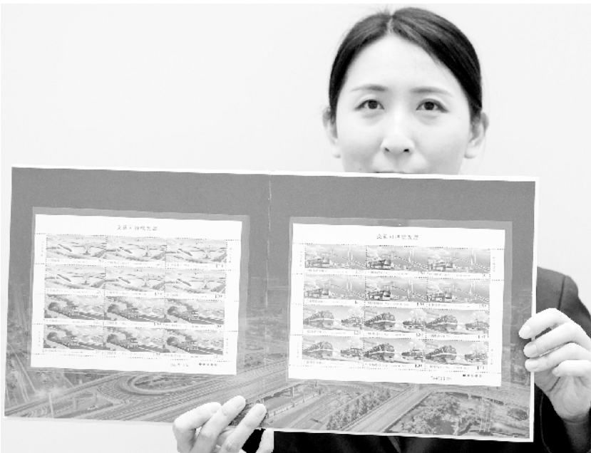
中国邮政发行《交通可持续发展》特种邮票

民主是各国人民的权利，而不是少数国家的专利。实现民主有多种方式，不可能千篇一律。在以习近平同志为核心的党中央坚强领导下，坚定不移走中国特色社会主义政治发展道路，不断发展全过程人民民主，社会主义民主政治必将更加充满生机活力，彰显独特优势，为人类文明进步贡献中国智慧和力量，为实现中华民族伟大复兴筑牢民主基石。（新华社北京10月14日电）