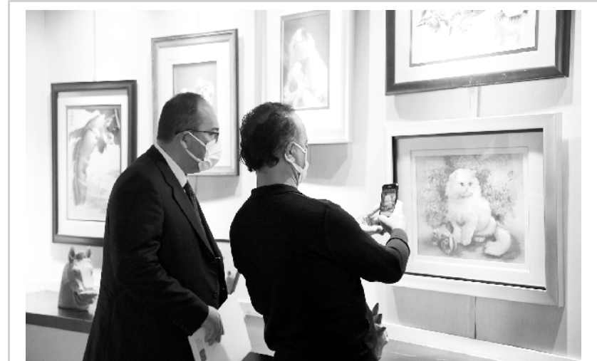
中国丝绸刺绣展在安卡拉开幕

10月14日，人们在土耳其首都安卡拉拉泽姆·希克梅特文化中心观看中国丝绸刺绣展。