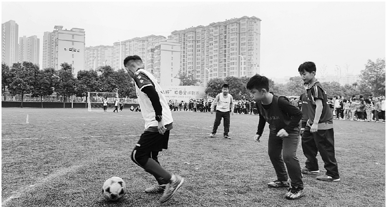
10 月 14 日,周口市文昌小学举行 2021 年“校长杯”校园足球联赛开幕式。作为全国青少年校园足球特色校,该校秉承“以球润德,以球健体,以球启智,以球育美”的理念砥砺前行,连续多年摘取“省长杯”“市长杯”奖杯。图为学生进行足球比赛。

与会老同志踊跃发言,各抒己见,对扶沟教体事业取得的成绩表示欣慰,为扶沟产业快速发展感到骄傲,对下一步工作提出了许多宝贵意见。