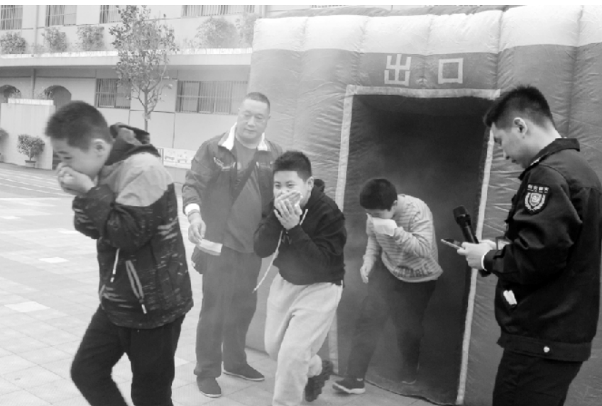
近日,周口市纺织路小学邀请某消防服务中心宣传员为全校教师作题为《关注消防,生命至上》的讲座,并开展了消防演练。图为学生在教官指导下体验逃生帐篷。

“美德始于心,节俭践于行。”同学们纷纷表示,要以本次活动为契机,在懂得粮食来之不易的同时,养成爱粮节粮、勤俭节约的好习惯,珍惜每一粒粮食。