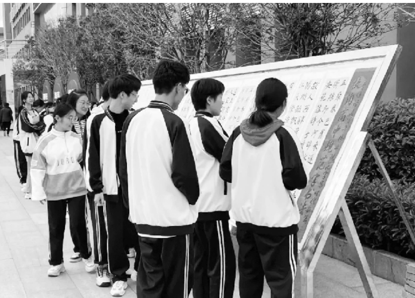
9 月 14 日以来,扶沟高中举办规范汉字书写比赛,丰富了校园文化生活,展示了“扶高”学子文明儒雅的精神风貌,让中华优秀传统文化根植于学生心中。

此次观摩会是一次交流,一次研讨,更是一次思维的碰撞。通过举行观摩会,老师们进一步更新了阅读观念,改进了教学方法,提高了课堂效率。