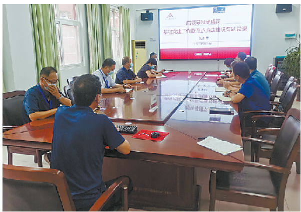
廉政建设专题党课。