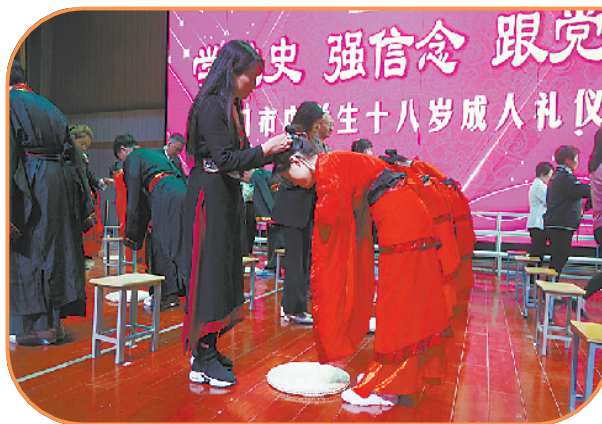
定期举行十八岁成人礼活动。