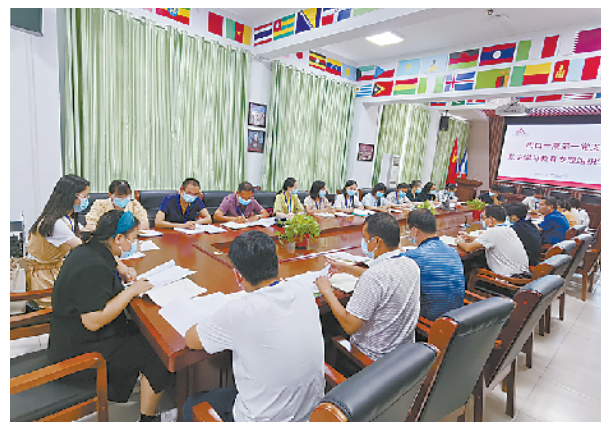
党史学习教育专题组织生活会。