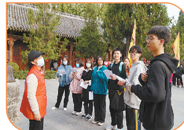
形式多样的主题研学活动。