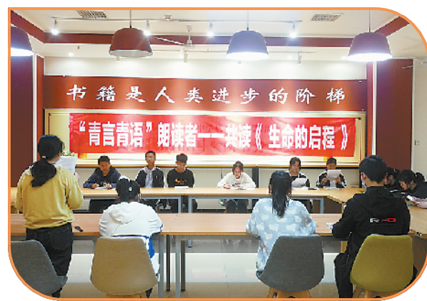
学生积极参与读书活动。

在对接新高考上,学校积极组织教师学习《国务院关于深化考试招生制度改革的实施意见》、普通高中《新课程标准》,撰写心得体会248篇;组织学习《中国高考评价体系》和