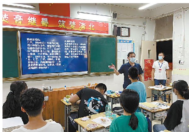
校领导每天坚持走进教室。