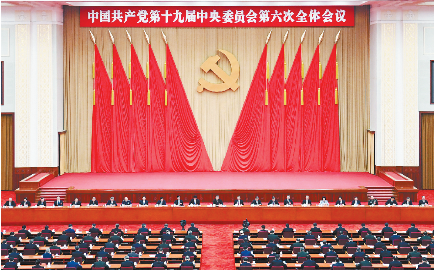
中国共产党第十九届中央委员会第六次全体会议，于 2021 年 11 月 8 日至 11 日在北京举行。

新华社北京 11 月 11 日电 中国共产党第十九届中央委员会第六次全体会议公报 (2021 年 11 月 11 日中国共产党第十九届中央委员会第六次全体会议通过) 中国共产党第十九届中央委员会第六次全体会议，于 2021 年 11 月 8 日至 11 日在北京举行。 出席这次全会的有，中央委员 197 人，候补中央委员 151 人。中央纪律检查委员会常务委员会委员和有关方面负责同志列席会议。党的十九大代表中部分基层同志和专家学者也列席会议。 全会由中央政治局主持。中央委员会总书记习近平作了重要讲话。 全会听取和讨论了习近平受中央政治局委托作的工作报告，审议通过了《中共中央关于党的百年奋斗重大成就和历史经验的决议》，审议通过了《关于召开党的第二十次全国代表大会的决议》。习近平就《中共中央关于党的百年奋斗重大成就和历史经验的决议（讨论稿）》向