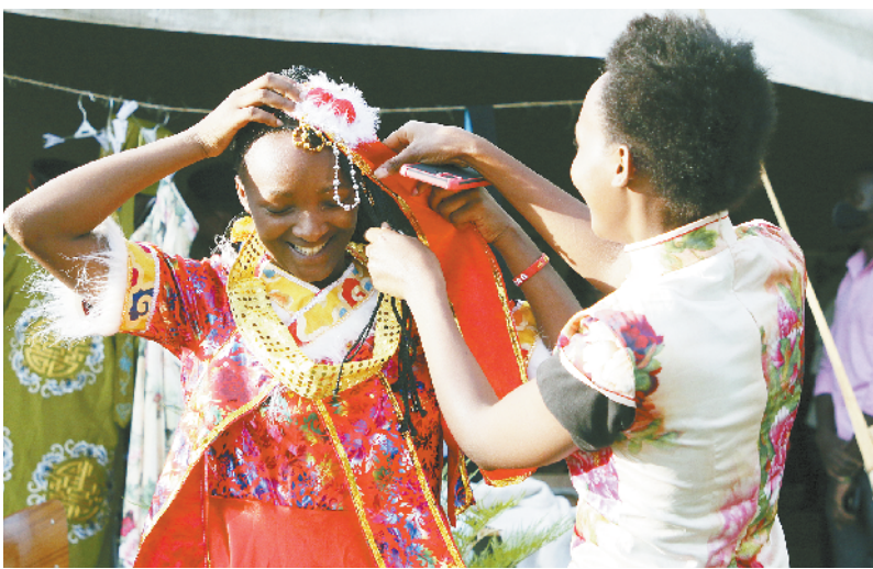
中国文化走进卢旺达校园

11月10日,学生在卢旺达卡卡扎孔试穿中国服饰。当日,“中国文化进校园”活动在卢旺达大学教育学院举办。今年该活动的主题是“体验中国文化,庆祝中卢建交50周年”。