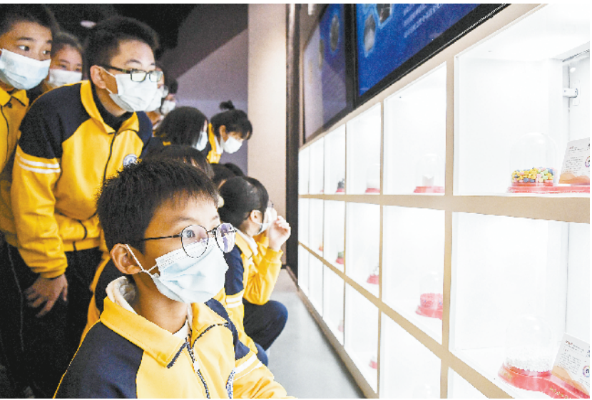
走进禁毒教育基地 增强学生拒毒意识 11月18日,学生在广西兴业县禁毒教育基地了解毒品的种类、特征和危害。当日,广西兴业县禁毒教育基地联合辖区内部分中学师生共同开展“识毒、防毒”主题实践课活动,通过参观禁毒展览、VR体验等形式,增强青少年学生的拒毒意识和能力。

习近平致信祝贺首届中国网络文明大会召开强调 共建网上美好精神家园 广泛汇聚向上向善力量