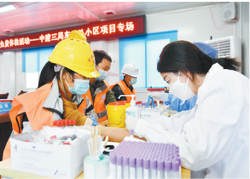
陕西:免费体检关爱农民工 11月19日,在西安市一处安置小区建设项目,中建三局西北公司工人在接受身体检查。 近日,陕西省总工会开展“送体检进工地”万名农民工免费体检活动,组织医务人员走进多家建设单位,分批次为一万余名农民工开展健康体检和医疗咨询。