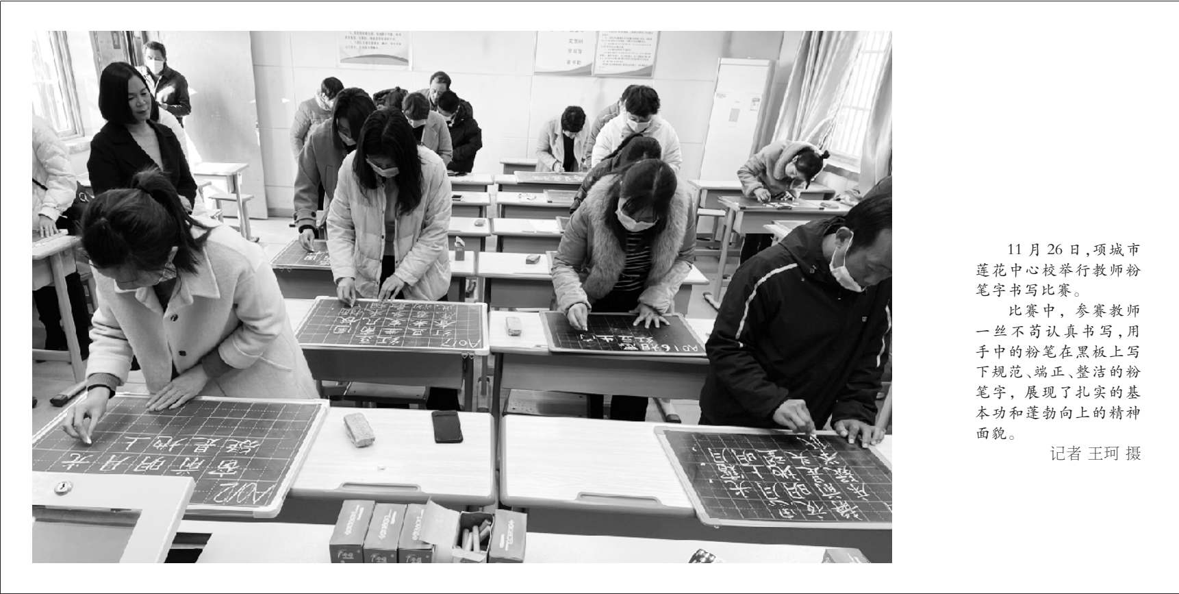
11月26日，项城市莲花中心校举行教师粉笔字书写比赛。 比赛中，参赛教师一丝不苟认真书写，用手中的粉笔在黑板上写下规范、端正、整洁的粉笔字，展现了扎实的基本功和蓬勃向上的精神面貌。

安全意识，提高了广大师生“做文明人，行文明路”的自觉性，为争创“平安校园”起到了积极推动作用。 据了解，该校还通过发放《告知家长一封信》等方式，做好文明交通宣传工作，为打造文明和谐的城市环境出一份力。