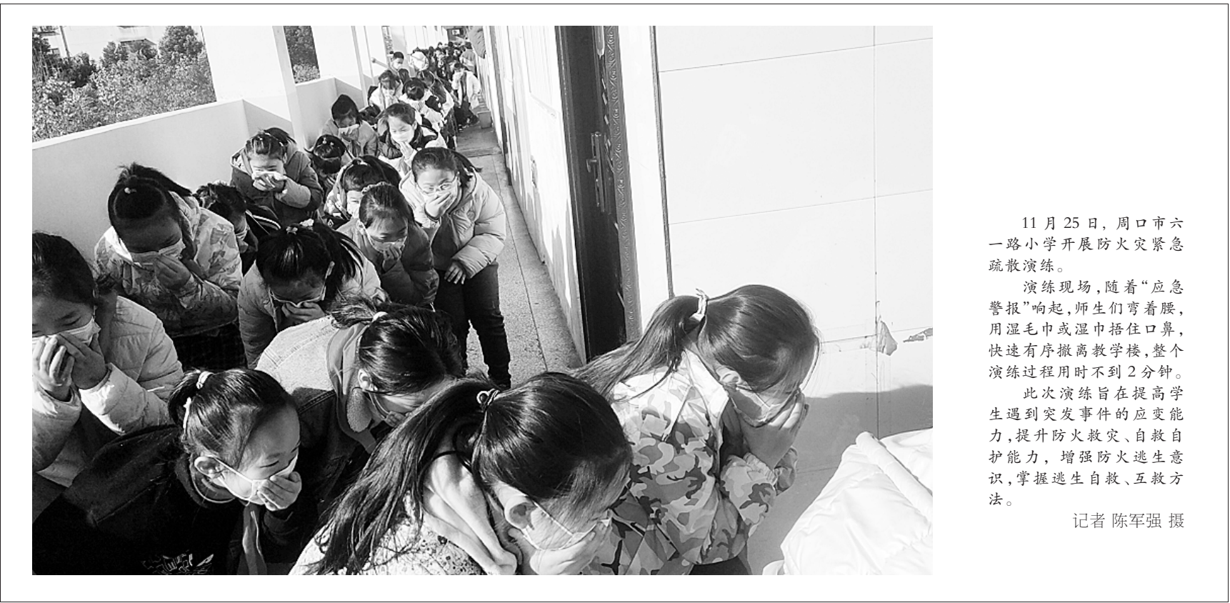
11月25日，周口市六一路小学开展火灾紧急疏散演练。 演练现场，随着“应急警报”响起，师生们弯着腰，用湿毛巾或湿巾捂住口鼻，快速有序撤离教学楼，整个演练过程用时不到2分钟。 此次演练旨在提高学生遇到突发事件的应变能力，提升防火救灾、自救自护能力，增强防火逃生意识，掌握逃生自救、互救方法。