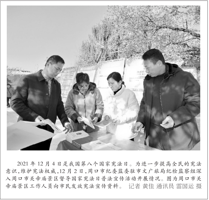
2021年12月4日是我国第八个国家宪法日。为进一步提高全民的宪法意识,维护宪法权威,12月2日,周口市纪委监委驻市文广旅局纪检监察组深入周口市关帝庙景区督导国家宪法日普法宣传活动开展情况。图为周口市关帝庙景区工作人员向市民发放宪法宣传资料。