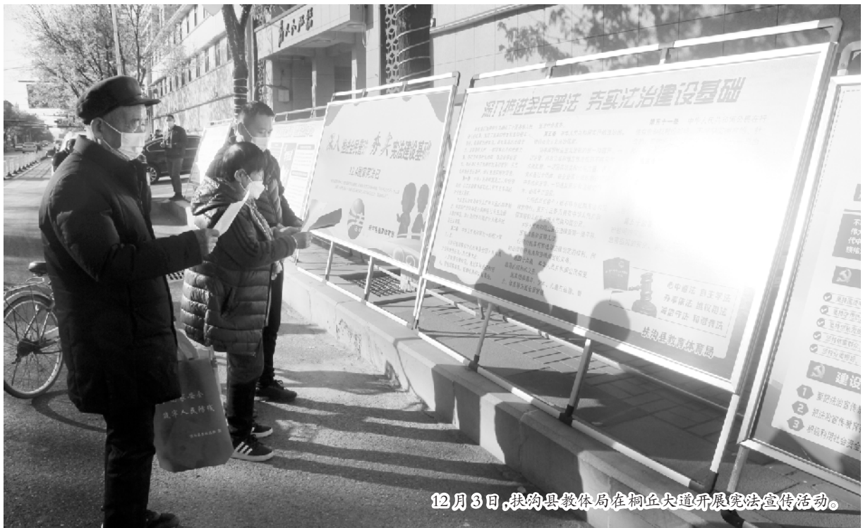
12月3日,扶沟县教体局在桐丘大街开展宪法宣传活动。