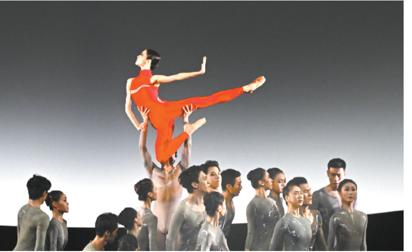
第五届中国国际芭蕾演出季闭幕

后续,神舟十三号航天员乘组将投入下一阶段在轨工作任务,以“感觉良好”状态迎接新年到来,这也将是中国航天员首次在太空跨年。