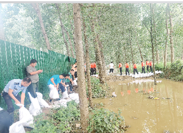
项城公安百名勇士支援西华防汛救灾