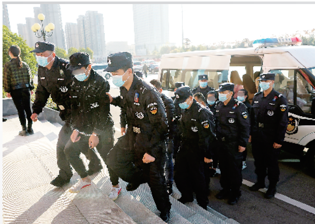
民警押解电信诈骗犯罪嫌疑人