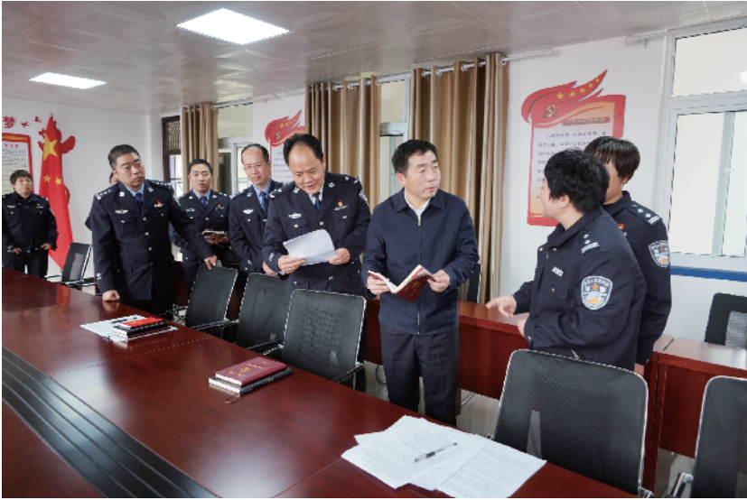
周口市副市长、市公安局局长张元明察看项城市公安局党建工作

2021年以来，项城市公安局以高度的责任感、使命感，主动作为，全力工作，经受各种挑战考验，出色完成了各项安保维稳任务，切实提升群众的幸福感和安全感，促进了社会大局稳定和谐。 圆满完成建党100周年安保及其他节日、会议维稳任务。2021年是中国共产党成立100周年，项城市公安局高度重视安保维稳工作，局党委认真分析形势，周密安排部署，全体公安干警凝心聚力、上下同心，守牢风险底线、纪律红线、安全防线，扛牢安保维稳责任，稳步开展工作，出色完成了各项安保任务，确保了节日期间没发生来自项城的干扰，得到了周口市公安局高度肯定，授予项城市公安局集体三等功。 突出对重点区域安全排查和巡逻。该局与项城市综治办、教育局联合对全市中小学幼儿园进行安全检查，共检查学校600多所，整治校园周边安全隐患190余处，下发责令限期整改通知书880余份。对该市123个金融网点进行安全隐患大排查，共发现安全隐患5处，已整改4处，限期整改1处。共清理排查出证件不全加油站2家。为加强对全市内部单位的管理，该局对学校、医院、银行、企业等重点内部单位建立档案和工作台账，做到有效监管，学校建档558家，银行建档87家，医院建档5家，自来水公司建档2家，“三电”建档4家，文物单位建档2家。加强对机关单位、金融单位、医院、学校、景区广场以及油电气热等重点单位、重点部位安全巡逻，落实“1、3、5”巡逻机制，切实提高街面见警率和管事率。一年来，共出动警力14000余人次，车辆5900余辆次，处置各类非法聚集事件26起，在巡逻中救助群众96次，抓获逃犯15