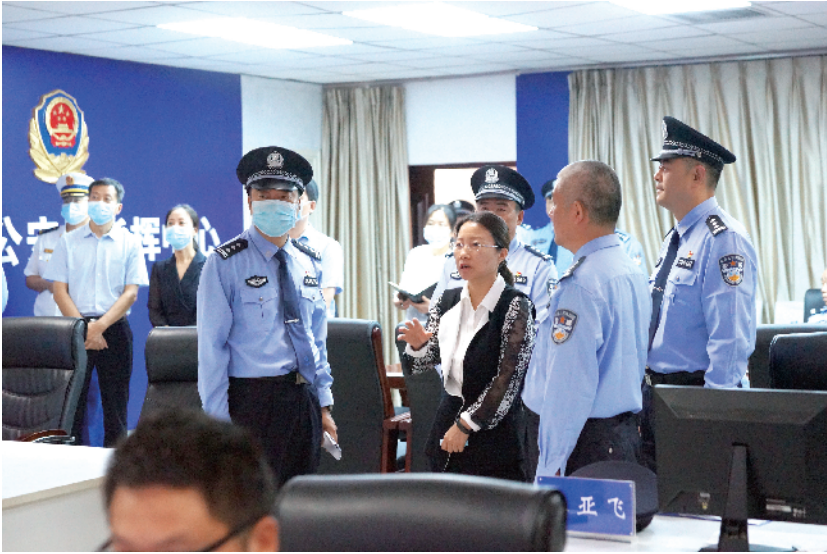
项城市委书记赵丹看望慰问国庆假期坚守岗位的一线民警辅警

一年来，项城市公安机关结合工作实际，从本职工作出发，保护群众、服务群众，与群众广泛沟通交流，通过一系列的警民互动，增进公安队伍与群众之间的了解和认识，从而广泛发动群众理解、支持公安工作，共同创建和谐、稳定的社会秩序。 ——全力服务全市疫情防控。2021年8月初，在南京、郑州等地疫情形势严峻，大量疫情数据需要尽快核查、落地排查、迅速反馈的紧急情况下，该局抽调精干警力成立疫