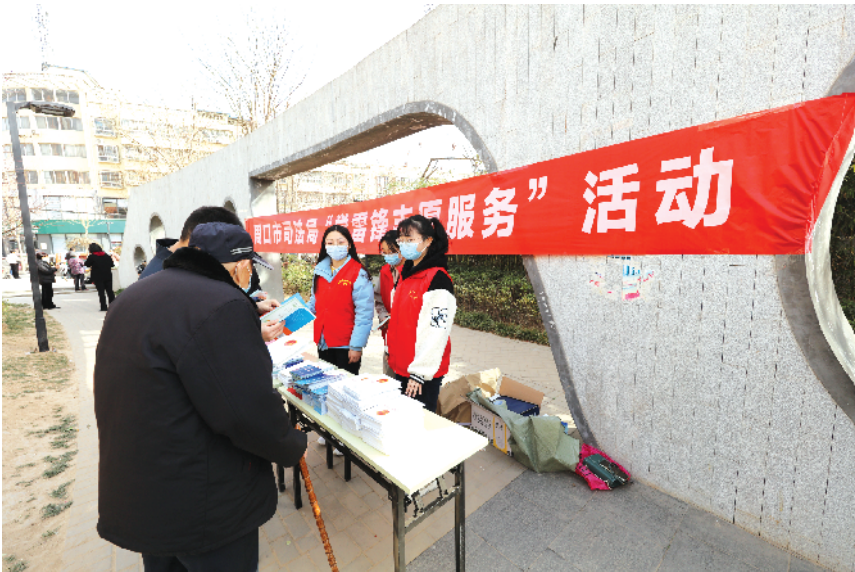
志愿者开展普法宣传。

新法实施 法援更便捷 2022年1月1日,《中华人民共和国法律援助法》正式实施,废除法律援助案件申请经济困难状况“证明制”,改经济困难证明为经济情况说明,全面推行诚信承诺制,切实做到简政便民,使法律援助申请更加便捷和人性化。全市法律援助机构不断加强农民工法律援助工作,深入开展“法援惠民生·助力农民工”“乡村振兴·法治同行”等活动,畅通农民工欠薪维权法律援助绿色通道,目前,通过司法部农民工欠薪求助绿色通道共办理农民工欠薪案件53件,为符合条件的农民工提供了法律援助服务。全面落实刑事案件律师辩护全覆盖工作,对经济困难公民和特殊案件当事人做到应援优援。在周口市中级人民法院、周口市看守所设立值班律师,在工青妇老残等部门建立联络机制,充分运用退役军人法律援助工作站、妇女儿童维权工作