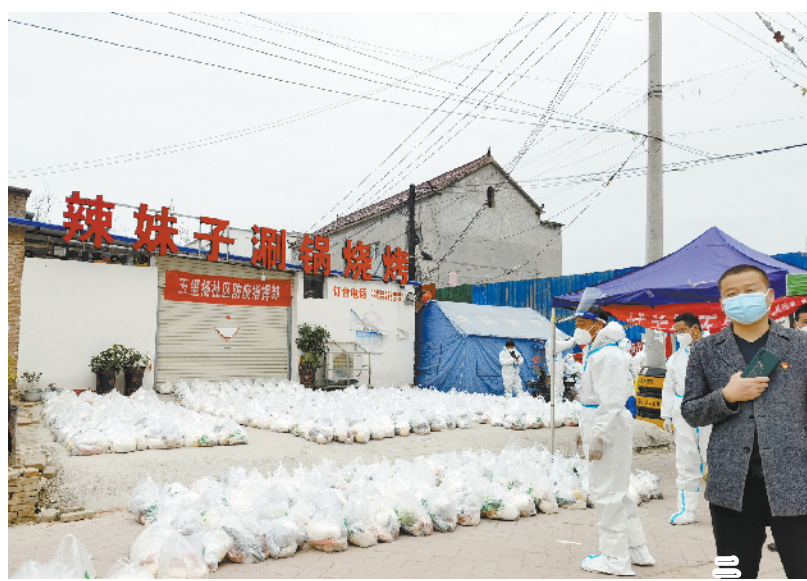
上图一、二:根据当前疫情防控严峻形势,太康县准备了5.1万份居民生活物资包,免费发放给城区居民,让大家安心居家抗疫。