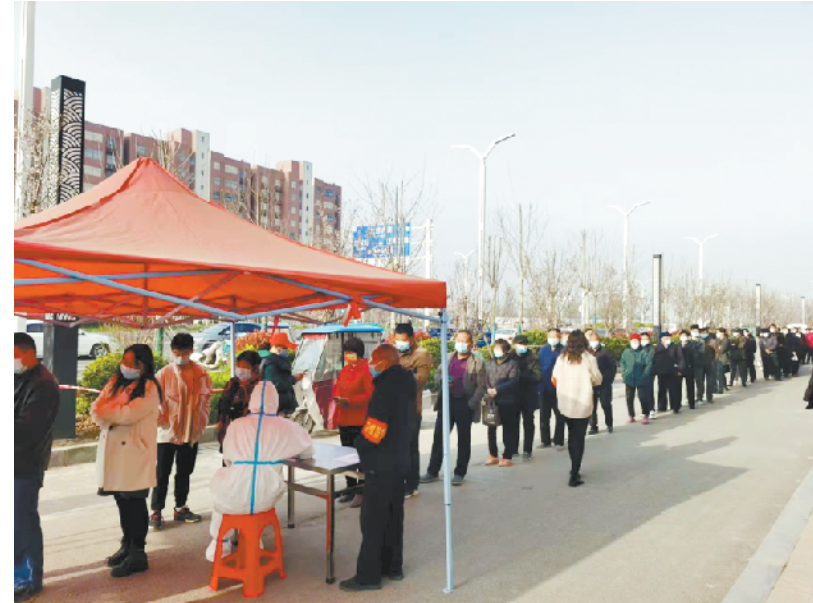
上图:为切实保障居民群众生命安全和身体健康,3月29日,周口港区在全域开展全员核酸检测。