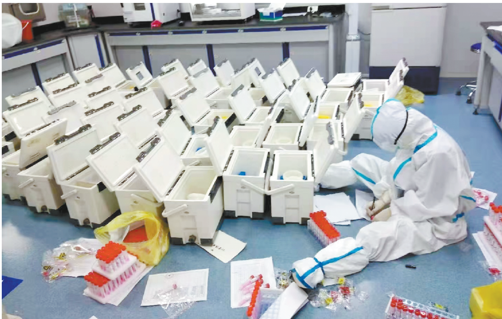
上图:沈丘县全员核酸检测工作开始后,该县疾控中心PCR实验室(新冠病毒检验室)的11名女同志全身心投入到核酸样本的检测中。她们克服常人难以想象的困难,用柔弱的肩膀支撑起了全县核酸检测工作,为抗击疫情奉献着自己的力量。截至3月27日,实验室共收到各核酸采样点转送的核酸标本11.69余万人(份),及时出具报告11.69余万份,核酸检测结果及时出具率100%,数据及时上传率100%。