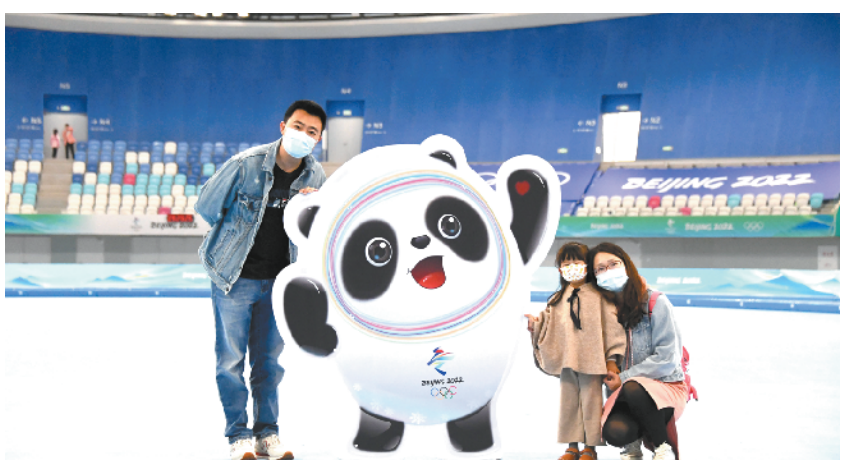
欢迎回家!建设者及家属走进“冰丝带”

各地区、各部门要着力纾困解难,全面落实对交通运输企业和个体工商户的扶持政策,关心关爱货车司机、快递员群体。要加强值班值守,精准落实疫情防控举措,对与本通知要求不符的防疫通行管控措施要立即整改。国务院有关部门要加大督导检查力度,对疫情防控措施层层加码、简单实行“一刀切”劝返、违规设置防疫检查点、擅自阻断运输通道的,要督促加快整改。对于严重影响货运物流畅通、造成物资供应短缺或中断的,要依法依规严肃追究有关地方、单位和人员的责任。