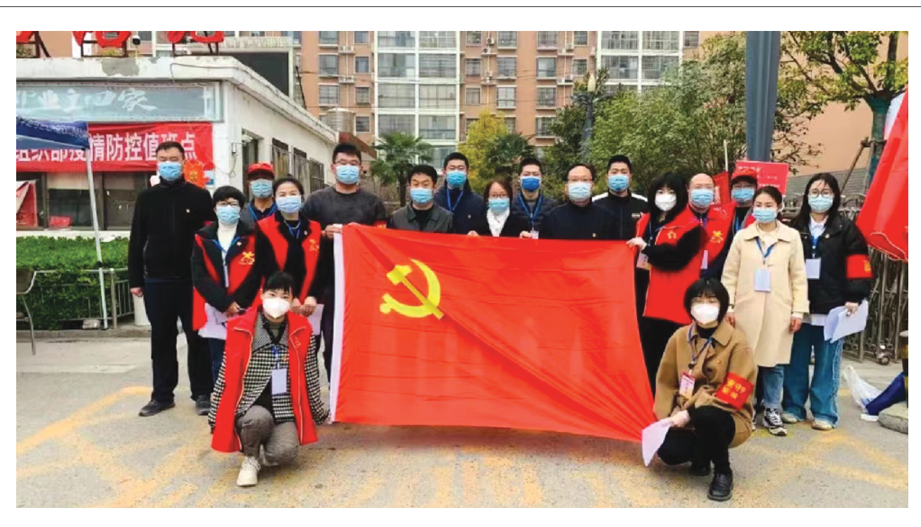
冲在防疫最前线的“红色兵团”

连日来,郸城县委组织部机关党员干部充分发挥模范带头作用,组成“红色兵团”,冲在疫情防控最前线,切实筑牢疫情防控严密防线。