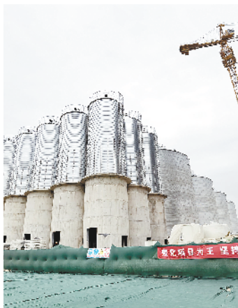
西华县双汇年80万吨饲料加工项目