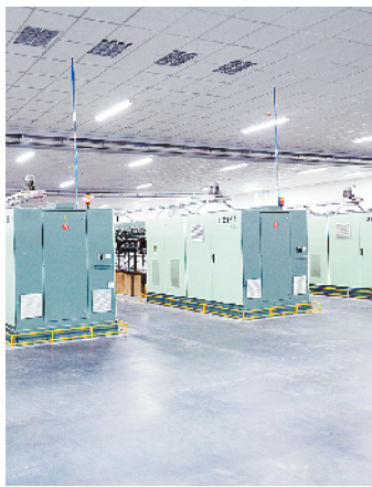
盛泰纺织年产1万吨高支纱项目