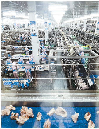
西华县双汇年加工1亿只肉鸡屠宰熟食项目