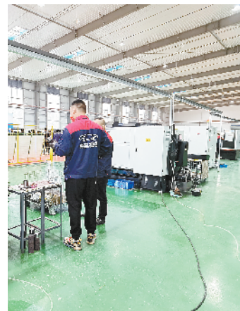
扶沟县装备制造产业园建设项目(一期)