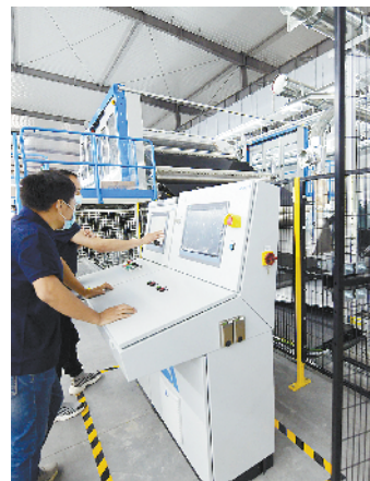
旭旺高端无纺布建设项目