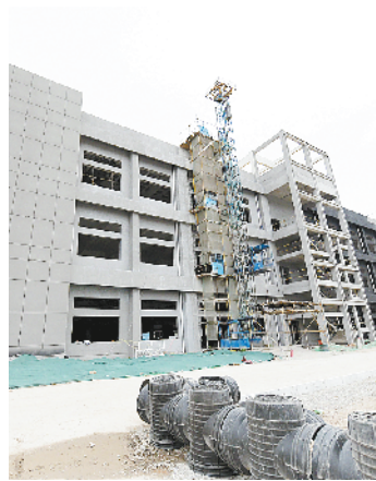
河南润商服饰年产2600万件婴幼儿服装项目

4月28日,我市重大项目建设“三个一批”观摩讲评活动继续进行,观摩团先后到商水县、西华县、扶沟县进行实地观摩。纺织服装产业链条日益完备、食品加工项目带动辐射能力不断增强、装备制造定位高端智能……各具特色的项目积蓄着周口高质量发展的强劲动能,提振着各地干事创业奋勇争先的信心决心。