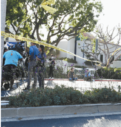
美国加州教堂发生枪击 造成1死5伤

现年66岁的马哈茂德2012年9月当选索马里总统,成为内战以来首位由联邦议会选出的总统,也意味着索马里长达21年政治过渡期的终结。