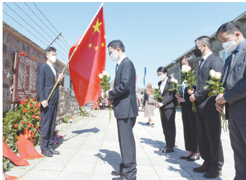
奥地利举行毛特豪森集中营解放77周年纪念活动

5月15日,在奥地利毛特豪森集中营纪念馆,中国驻奥地利大使馆代表向遇难中国同胞敬献花圈。