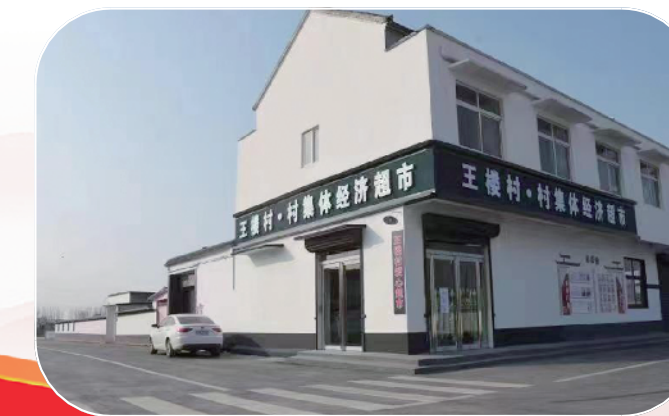
王楼村集体经济超市。