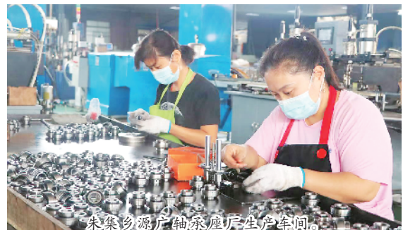
朱集乡源广轴承厂生产车间。

“小车间”托起致富“大希望”。周口颍风服饰服装加工企业是一个集产品研发、打板设计、生产加工、直播销售于一体的网红企业,不仅有每年近千万元的销售额,还带动周边300多名贫困群众就业。近两年,在乡党委政府招商政策、用工服务的支持下,这样的“家门口”企业先后有27家在朱集投产运营,累计带动就业5000余人次,群众年均增加收入5万余元。