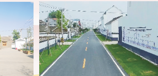
环境优美的王店乡街景。