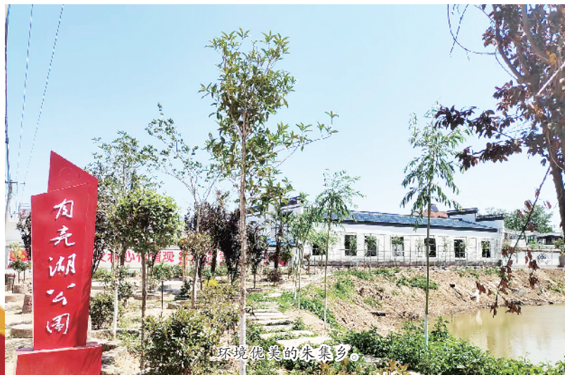
环境优美的朱集乡。