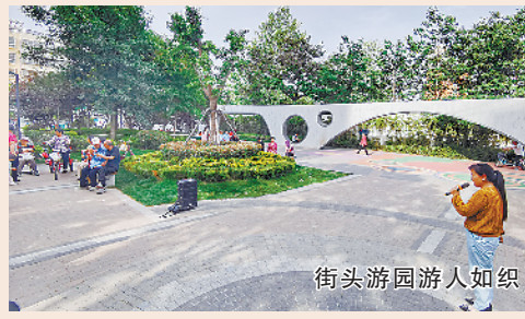
街头游园游人如织

有序推进城市更新。持续推进老旧小区、老旧街区、老旧厂区改造,统筹推进历史文化街区组团、居住旧城改造组团,打造沙颍河、贾鲁河老城区段生态景观带,切实改善老城区居住环境,提升居民生活品质。其中,历史文化街区将以现有历史建筑为载体,创造开放空间,传承城市文脉,挖掘文化内涵,修复活化历史文化街区,留住城市肌理。