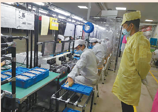
富士康(周口)科技园

电子信息产业是川汇区的主导产业之一。作为龙头企业,工业富联富士康(周口)科技园项目一期已经投产,二期工程和18万平方米工业邻里中心正在紧锣密鼓施工。项目最终达产后,可提供2万个就业岗位,年产值约30亿元,为周口高质量发展增添强劲动力。