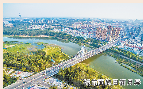
城市面貌日新月异

打造商贸物流电商发展新高地。依托周口华耀城市场,川盛荷花商城、家美仓储物流园,建设华耀城商贸物流、跨境电商商圈,形成豫东南有影响的商贸物流、电商中心。