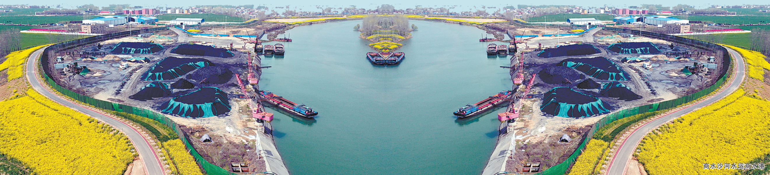
商水沙河水上商水港

站在新起点,谋求新跨越。商水县正乘着市委五届二次全会的东风,向着新征程全速启航!