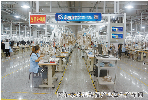
阿尔本服装科技产业园生产车间