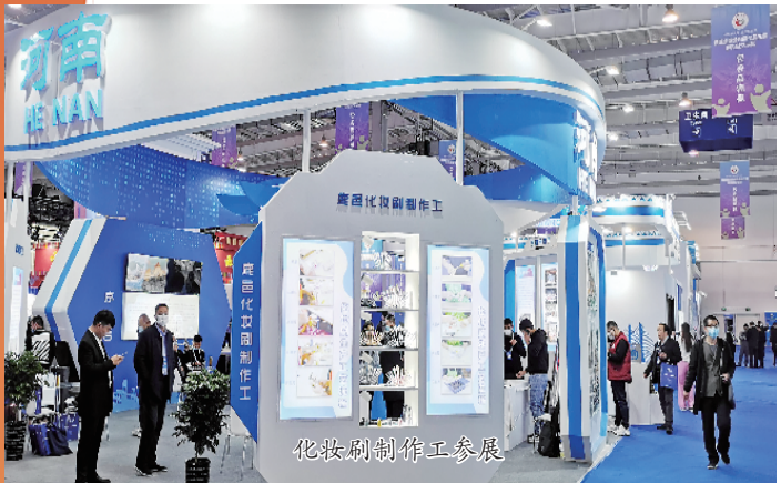
化妆刷制作工参展