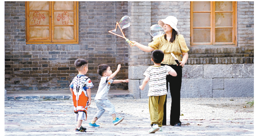
文化产业发展改变豫北山村面貌

我要强调,台海和平稳定的定海神针是一个中国原则,中美和平共处的真正“护栏”是三个联合公报。“倚美谋独”死路一条,“以台制华”注定失败。面对国家统一的民族大义,中国人有不信邪、不怕鬼的骨气,有吓不倒、压不垮的志气,有万众一心、众志成城决心,更有坚决捍卫国家主权、民族尊严的能力。