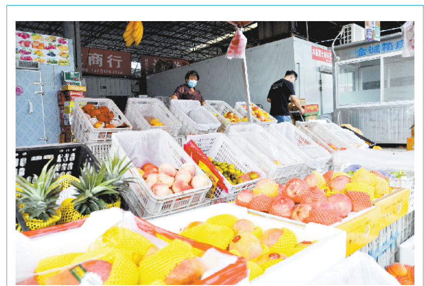
8月19日清晨,黄淮农产品物流市场内人潮涌动,各种瓜果蔬菜源源不断地从这里走进市民的“菜篮子”。连日来,黄淮农产品物流市场严格落实疫情防控政策,对上班工作人员以及经营户进行核酸检测检查,只有阴性且体温正常才能到岗,每一位进入菜场的市民需要测温亮码、佩戴口罩才能进入,以确保市场正常运行。

“下一步,贾寨行政村将谋划发行5.4亿元乡村振兴专项债,为后期项目的体制扩容提供资金保障。”搬口办事处党委书记张旭介绍,搬口办事处在贾寨行政村打造田园综合体方面,计划建设300亩地的观光农业项目,100亩地的体验式农业项目,打造5000平方米的研学基地;在文旅项目方面,计划建设16000平方米的欢乐谷,新建2800平方米的专业酒吧,建设5000平方米的电竞主题宾馆和4000平方米的中式民宿项目,围绕观瞻性和体验性划分7街9巷全面提升改造村民住宅,实现全村全域景观化。②5