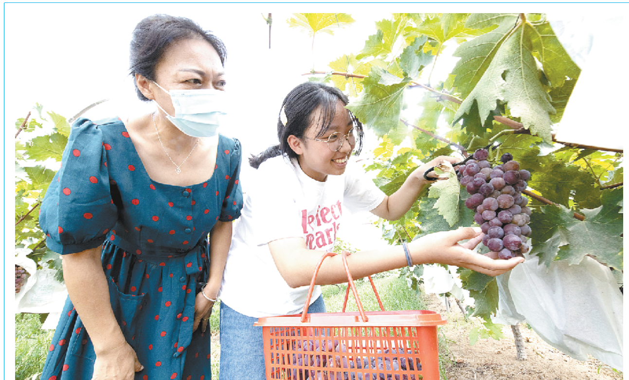
(上接第一版) 从制造到“智造”

经过不断发展壮大,现在的河南四通锅炉有限公司拥有门类齐全、工艺精良、技术先进的加工、切割、焊接、检测、专用设备与生产流水线,包括数控激光切割、数控等离子切割机、数控剪板机、数控刨边机、数控钻床、自动埋弧焊机、焊接机器人、无损检测、光谱分析、洛氏硬度计、力学性能、化学分析、压力试验设备等。在实现自动化的同时完成节能环保的使命,在生产工艺上完成了由传统制造到智能制造的转变。