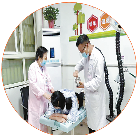
特色中医疗法融入妇幼健康服务