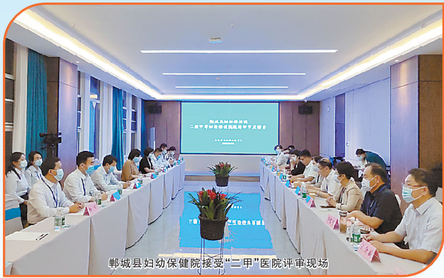
郸城县妇幼保健院接受“二甲”医院评审现场

10月19日，周口市卫生健康委员会发布周卫妇幼函〔2022〕5号文件，公布《周口市卫健委关于郸城县妇幼保健院通过二级甲等妇幼保健院评审的通知》，评审结果显示，郸城县妇幼保健院达到二级甲等妇幼保健院标准，且社会公示无异议。这标志着郸城县妇幼保健院综合服务能力得到进一步提升，再一次为“国家级妇幼健康优质服务示范县”——郸城县增辉添彩。