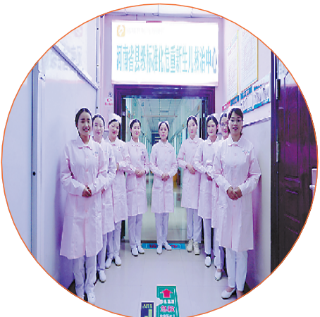
省级危重新生儿救治中心医护团队