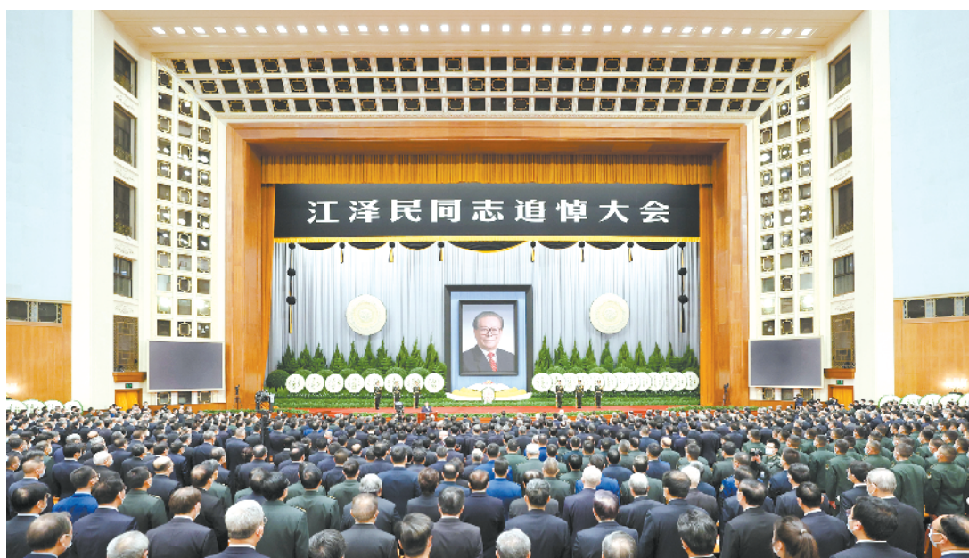
12月6日，中共中央、全国人大常委会、国务院、全国政协、中央军委在北京人民大会堂隆重举行江泽民同志追悼大会。