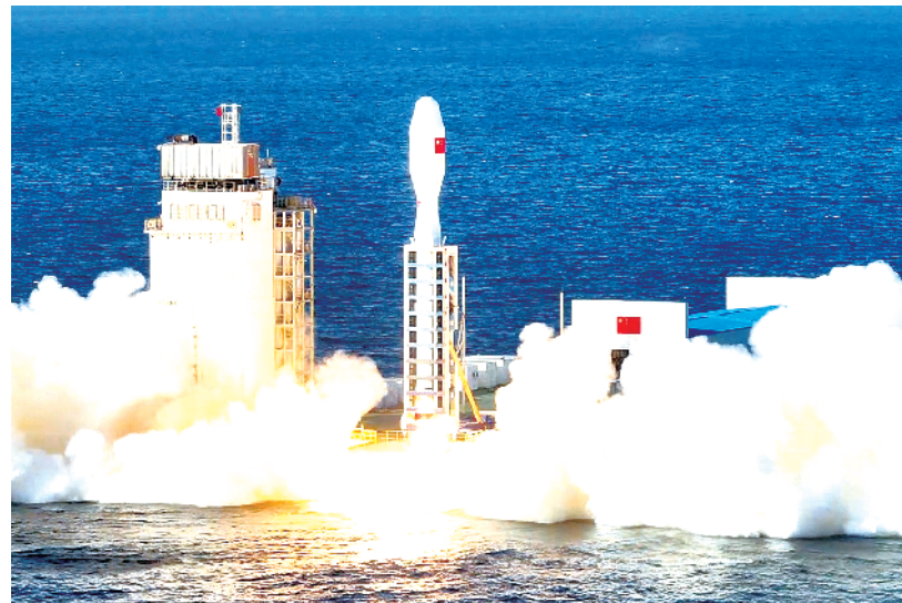
“一箭十四星”!捷龙三号运载火箭首飞成功

12月9日14时35分,我国太原卫星发射中心在黄海海域使用捷龙三号运载火箭,采用“一箭十四星”方式,成功将吉林一号高分03D47-50星、东坡08-10星等14颗卫星顺利送入预定轨道,发射任务获得圆满成功。