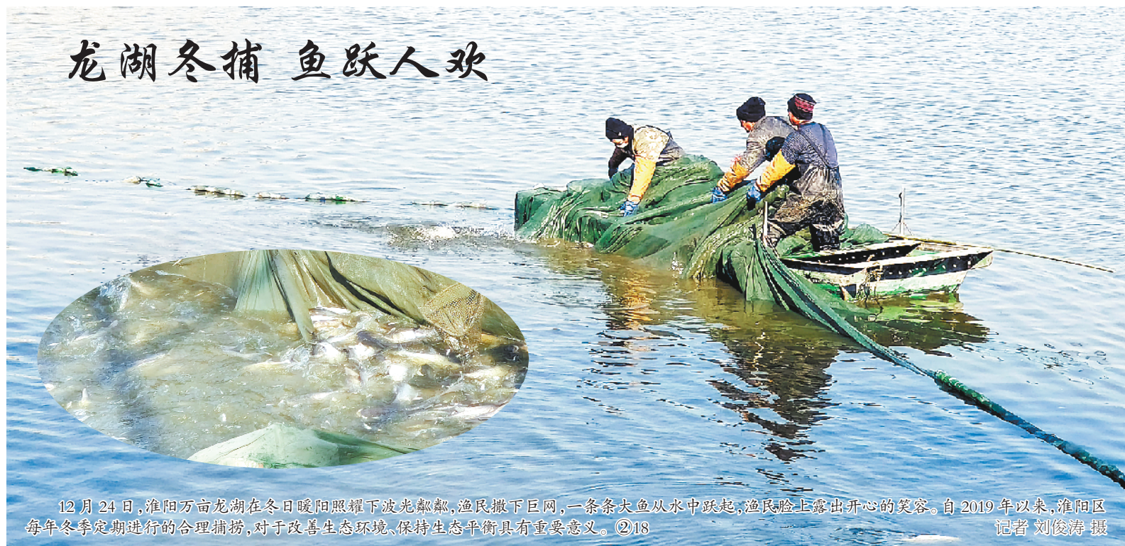
龙湖冬捕 鱼跃人欢

12月24日，淮阳万亩龙湖在冬日暖阳照耀下波光粼粼，渔民撒下巨网，一条条大鱼从水中跃起，渔民脸上露出开心的笑容。自2019年以来，淮阳区每年冬季定期进行的合理捕捞，对于改善生态环境、保持生态平衡具有重要意义。②18