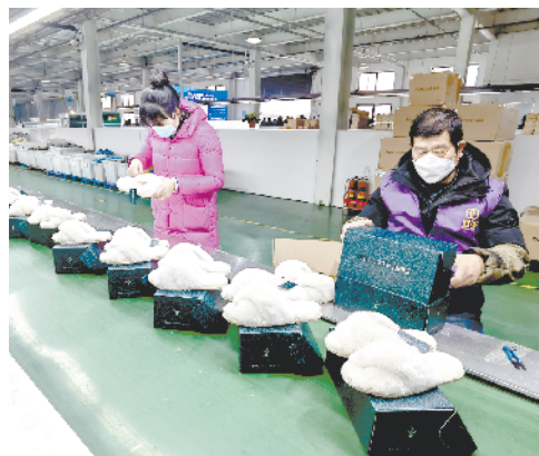
项城市双强鞋服有限公司年产300万双成品鞋项目