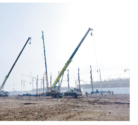
河南豫树食品有限公司年产2000万件方便食品项目