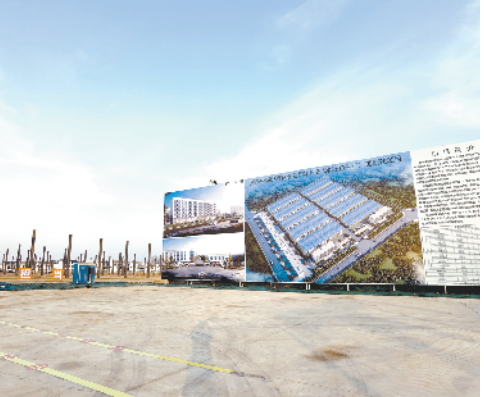
河南中福织造有限公司智能化5G喷水织机坯布生产二期新建项目