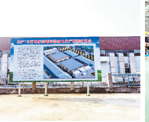
鹿邑县茂源肉业有限公司年产15万吨羊肉制品生产线建设项目