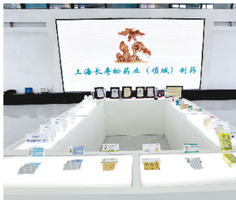
上海长寿松药业(项城)制药/生物医药原料药研发生产项目

12月28日,全市四季度“三个一批”重大项目建设观摩讲评活动启动。本次观摩范围是10个县(市、区),周口临港开发区主导产业项目各3个。当天,观摩组深入项城市、沈丘县、郸城县、鹿邑县、太康县,对15个县域主导产业项目进行观摩。从观摩情况看,各县市聚焦主导产业,强化链式思维,持续精准发力,产业集聚效应日益凸显,新产业新业态新模式不断涌现,转型升级成为最强音,经济高质量发展驶入了创新赋能的快车道。