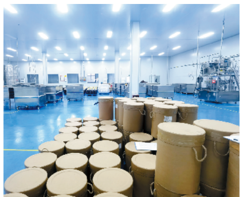
鹿邑县伟红食品有限公司年产10万吨辣椒制品生产线建设项目

该项目总投资5.5亿元,总建筑面积约11.2万平方米,规划建设标准化厂房13栋、研发楼、办公楼、职工宿舍及其他配套设施,引进喷水织布机2000台、500台经编机及高科技喷水机械制造。目前,项目正在建设中,预计2023年底建成投产。项目全部建成后,年产2亿米坯布,年产值约16亿元,年实现税收约2亿元,安排就业1000人以上。①6