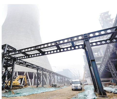
河南安钢周口钢铁有限责任公司焦化配套项目