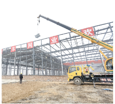
河南长丰网业聚酯网项目