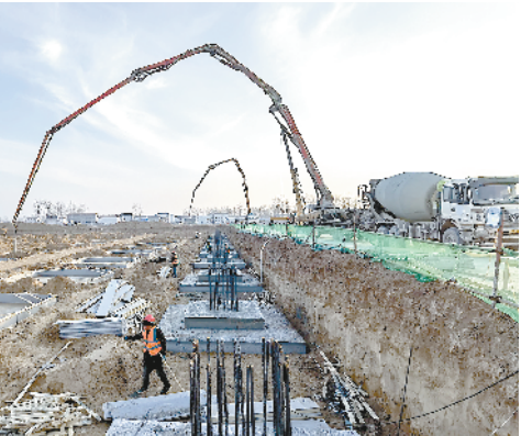
太康县纺织服装产业园鸿发织造年产1.2亿米坯布及年产1200万套职能服装新建项目