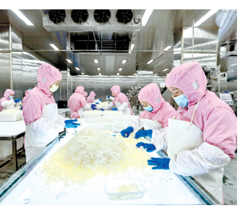
鹿邑县和一肉业有限公司牛肉精加工生产建设项目