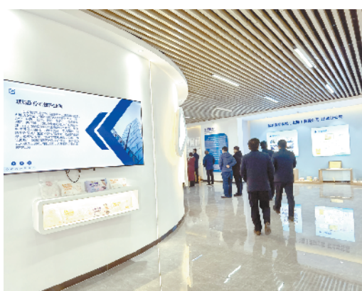
项城市医疗科技产业园医用耗材、新型复合纤维纸尿裤生产及精准医疗产业化项目