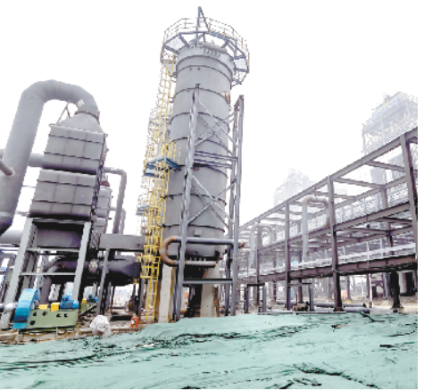
金丹科技年产12万吨生物降解聚酯及其制品项目