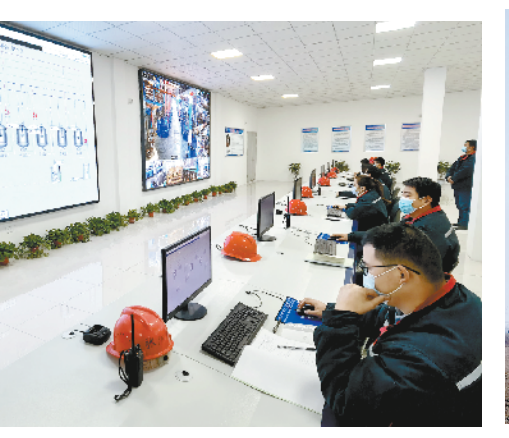
巨鑫生物合成药及医药中间体智能制造提升改造项目