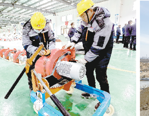
红热燃烧科技河南有限公司年产10万台燃气超低氮燃烧器一期项目