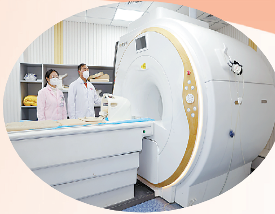
先进的核磁设备提升服务能力