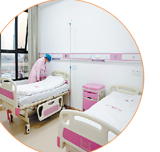
标准化病房明亮而温馨