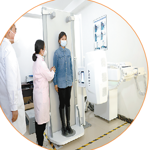
专业的DR设备进驻提升服务能力