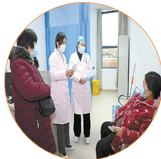
郸城妇幼分院区医护人员用心用情为群众诊疗