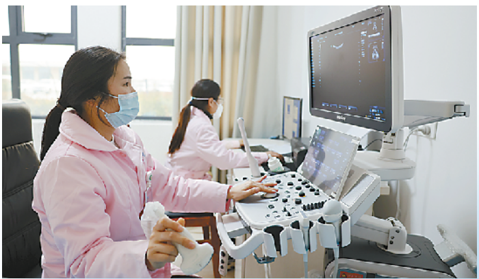
郸城妇幼彩超服务名扬全国

党的十八大以来,郸城县第四医疗健康服务集团县妇幼保健院紧紧围绕打造“强专科、大综合、优保健”的战略目标,直面困境、克难攻坚、奋力拼搏,用追梦“加速度”,把一个个不可能变成了可能,如期完成“十三五”规划和《妇女儿童发展规划纲要》妇幼健康各项目标,妇幼健康事业高质量发展步入“快车道”。2022年10月,该院成功创建二级甲等妇幼保健院,实现了医院内涵建设、服务质量和综合管理水平的飞跃,开创了该院发展史上一个新的里程碑。