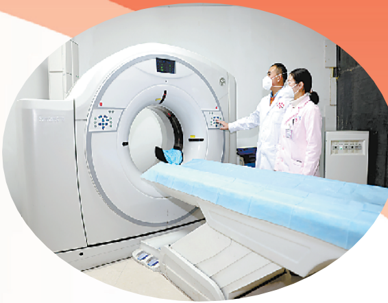
先进的CT设备提升服务能力