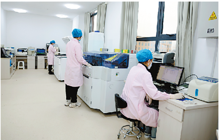
人员专业、设备专业的检验室