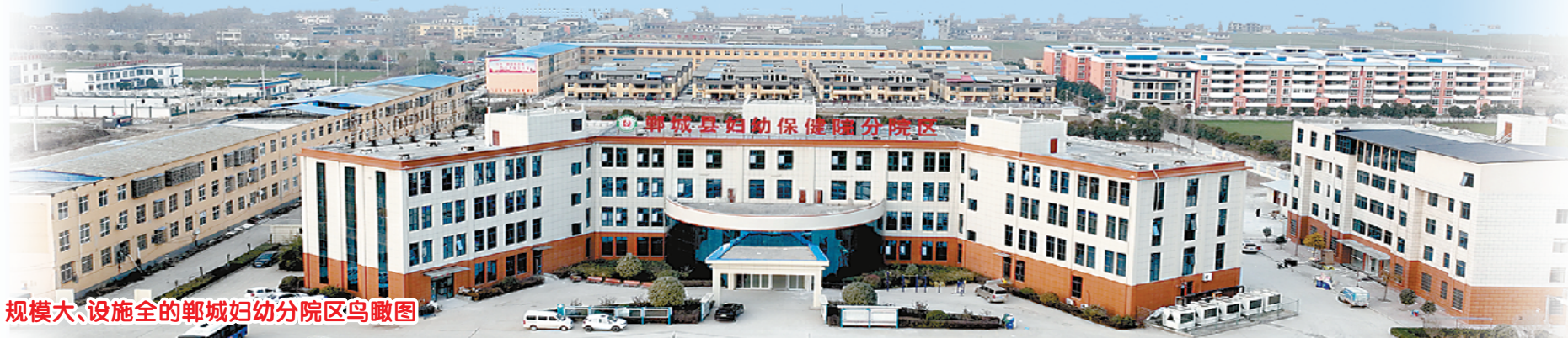
规模大、设施全的郸城妇幼分院区鸟瞰图