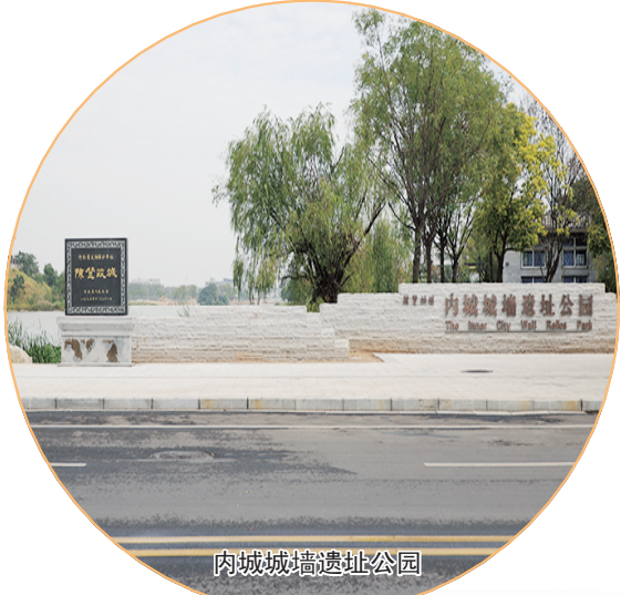
内城城墙遗址公园