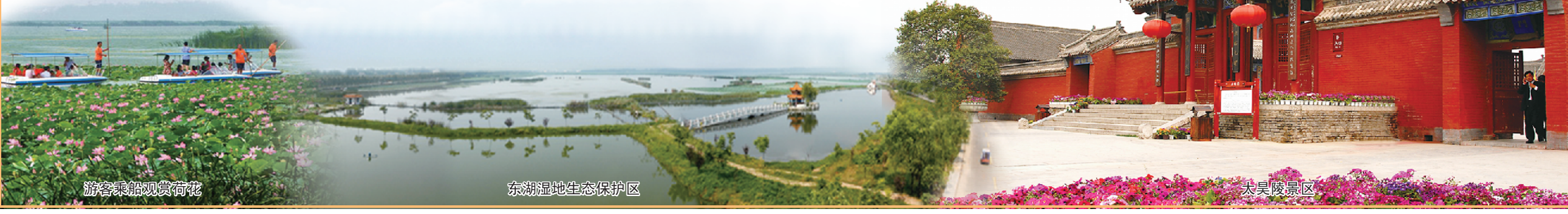
游客乘船观赏荷花