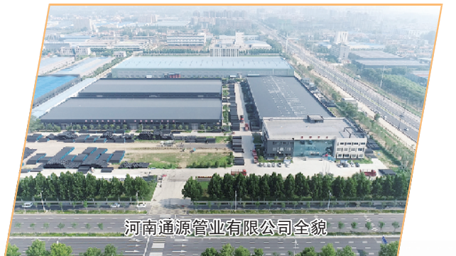
河南通源管业有限公司全景