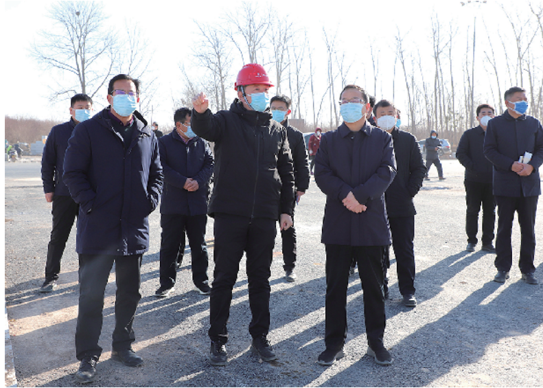
淮阳区委书记张建党带队调研项目建设