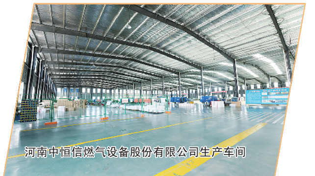
河南中恒信燃气设备股份有限公司生产车间

率达到国家生态园林城市创建标准。第二污水处理厂、垃圾焚烧发电厂投产运营,成功创建省级生态县。 这一年,深化改革注入活力,发展效能越来越高。 深化“放管服”改革,优化审批流程,推行企业开办事项“一网通办、一次办妥、一日办结”,新增市场主体13917户,同比增长22%。上线“准好办”APP,400个高频事项实现“一键受理、掌上办理”,营商环境进一步优化。深化“万人助万企”活动,累计帮助企业解决各类问题317个,帮助企业申请贷款39亿元,减缓退税3.76亿元,“淮材准用”采购本地产品价值4.2亿元,在全市“万人助万企”活动推进会上作了典型发言,活动的广度和深度进一步拓展。 这一年,枝叶关情惠民生,发展温度越来越暖。 下最大力气解决群众的操心事、烦心事、揪心事,让群众的生活越来越美好。获得感更加充实,以“人人持证、技能河南”建设为抓手,新增城镇就业14709人、技能人才3万人、高技能人才1万人。7所中小学、幼儿园投入使用,完成“民转公”学校12所,新增学位1.9万个,“双减”工作被中央电视台作为先进典型报道。深入开展“关爱你我他·温暖千万家”行动,多举措纾解蔬菜滞销难题,帮助菜农销售蔬菜2000万余斤。幸福感受更可持续,区人民医院、区妇幼保健院、区第五人民医院建成投入使用,周口市第一人民医院新院区加快建设。发挥医共体集团医疗资源优势,“小病不出村、常见病不出乡、一般大病不出区”有序就格格局初步形成。区第一、第二综合养老服务中心建成投用,3个乡镇社会养老服务中心、7所社区养老服务中心改造提升项目正式运营,一批高品质老年驿站投入使用,织密城区“15分钟养老服务圈”,打通农村养老“最后一公里”。安全感更有保障,社会治理综合服务中心投入运行,建立矛盾纠纷人民调解、访调对接、诉前调解多元调处化解机制。“三零”创建成效扎实,安全生产“十五条硬措施”落实情况全市排名第一,受到省安委会通报表扬。信访量、安全生产事故、刑事案件三类指标大幅下降,荣获“全省平安建设优秀区”,被评为“全国信访工作示范区”。 乘风破浪浪头立,扬帆起航正当时。淮阳区将高举习近平新时代中国特色社会主义思想伟大旗帜,在市委、市政府的坚强领导下,坚定必胜的信念、高扬发展的旋律、点燃奋斗的激情,奋力谱写中国式现代化淮阳绚丽篇章,以更加优异的成绩贯彻落实党的二十大精神!