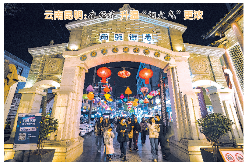
这是1月11日拍摄的高南街巷一景。

“中国网事·网络感动人物评选活动”由新华网、新华社“中国网事”栏目承办,自2010年起已举办十三届。今年的颁奖典礼由中共武汉市江夏区委、武汉市江夏区人民政府协办。该活动以普通百姓为报道和评选对象,由新华社记者走访基层挖掘感人故事,不同机构推荐候选人,发动网民通过新媒体方式进行线上、线下评选并举行年度颁奖典礼。