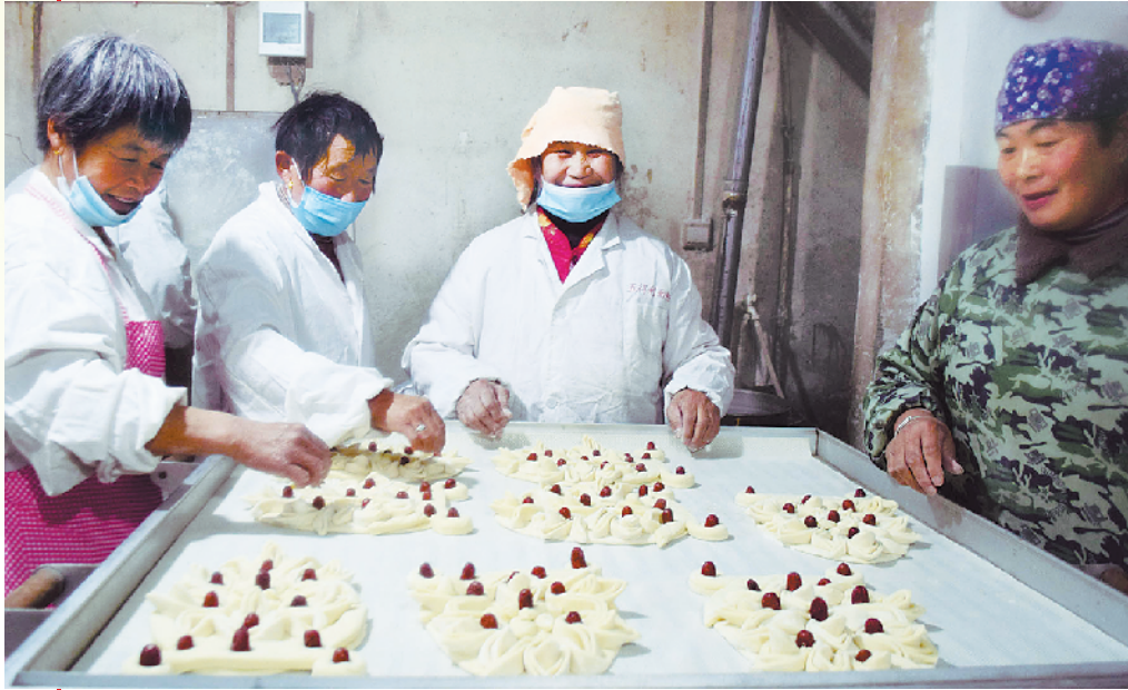
淮阳区新站镇一家馍店正做枣山