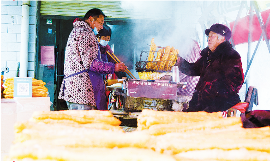
传统习俗炸新年油条