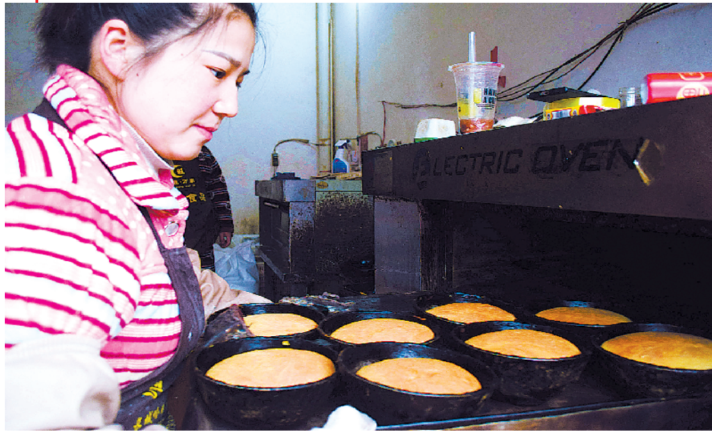
郑集乡街上一家蛋糕店生产新年蛋糕大馍

“腊八、祭灶、新年来到”，过了腊月二十三——小年，就意味着新年盖头已经揭开。作为最隆重的传统节日，新年寓意深厚，寄托着人们对新时光新生活的无限期盼和祝福，一切从新开始，构想新生活，谋划新发展。