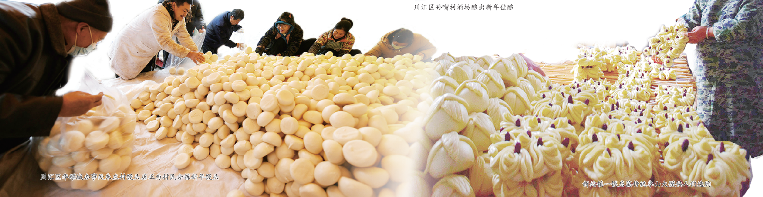
川汇区华耀城办事处朱庄村馒头店正为村民分拣新年馒头