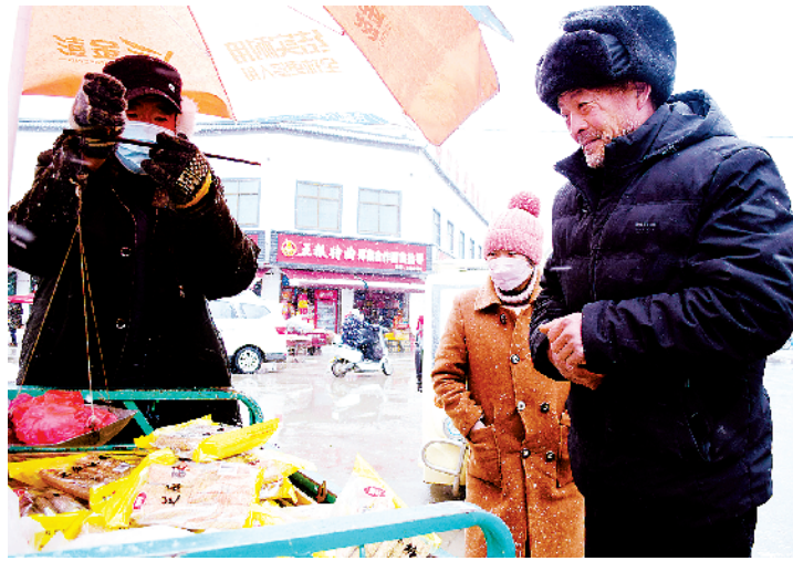
淮阳区郑集乡街头老农出售用麦芽做成的祭灶糖