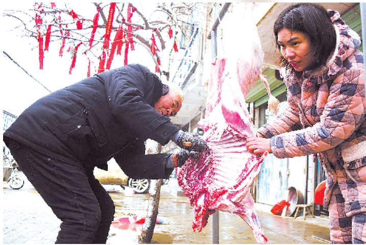
新站镇农民宰杀本地山羊过新年

小年这天，记者迎着漫天飞舞的雪花，探访川汇区、淮阳区等地，用镜头记录着人们迎新年场景，以这些零碎的新年图像记事，向传统致敬！