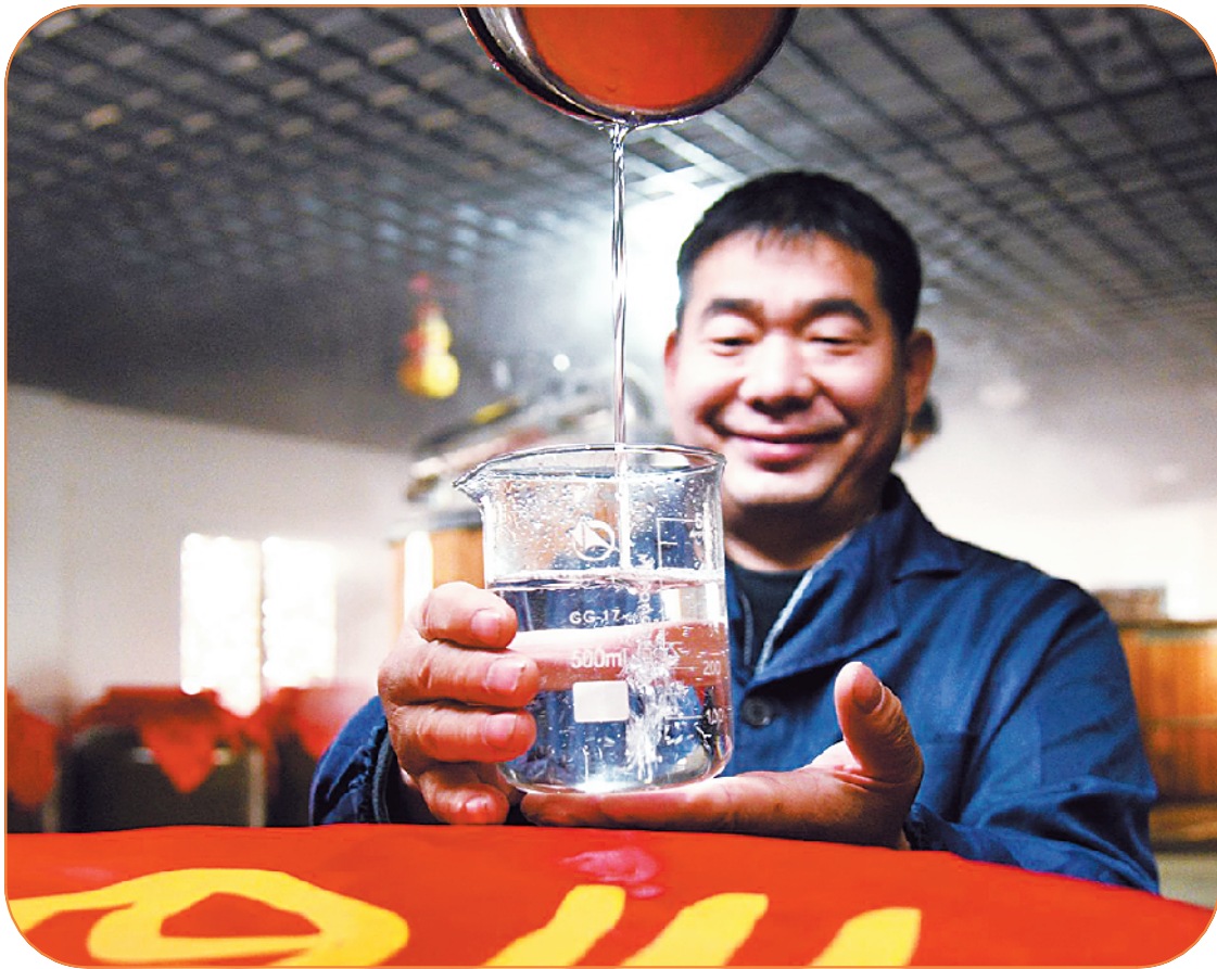
川汇区孙嘴村酒坊酿出新年佳酿