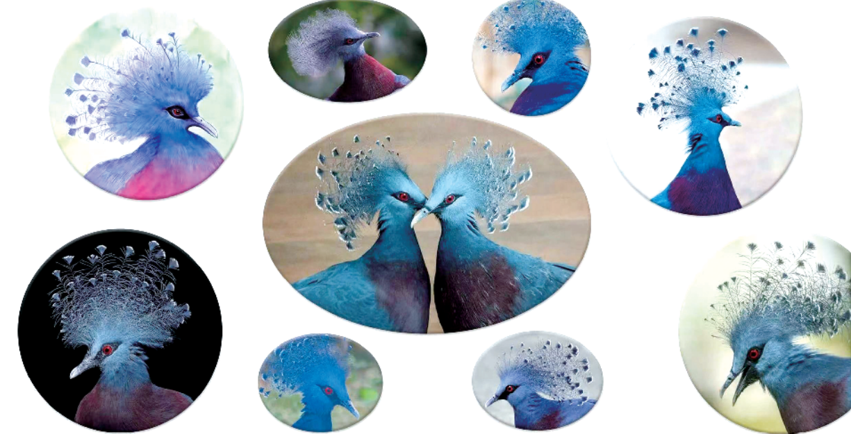
“飞鸟世界”拟引进的风冠鸠属

在新起点上,周口国际杂技文化产业园将在优势基础上阔步向前,深入贯彻省委、省政府建设文化强省的工作部署,加速“以文化城”战略实施,深挖周口道家文化,倾力打造以老子为主题的大型演艺节目,大力弘扬杂技文化,不断丰富生态文化和演艺文化,持续完善文旅产业链条,把周口杂技这张亮丽的文化名片擦得更亮!②2