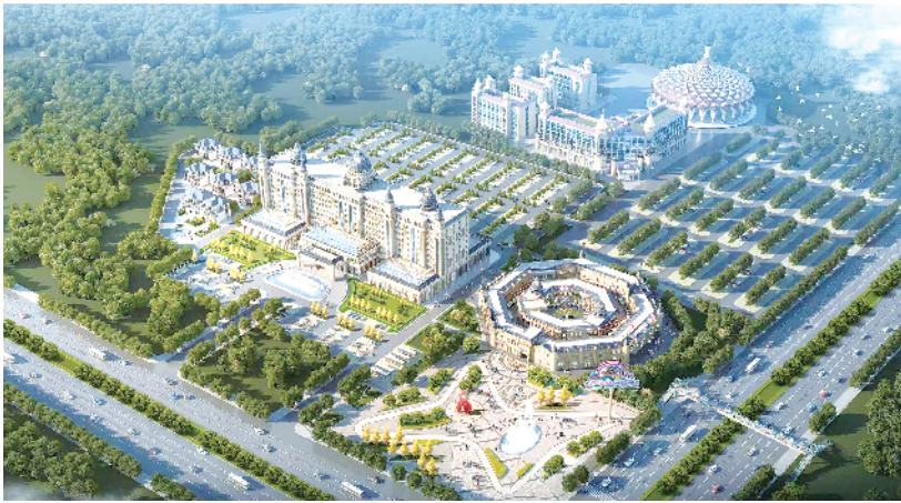
欢乐世界国际大酒店概念鸟瞰图

浓厚的杂技艺术氛围,催生了周口众多的杂技户、杂技村、杂技乡。据不完全统计,目前,周口拥有专业杂技团150多个,业余杂技团和杂技班近700个,加上散处全国各地的家庭杂