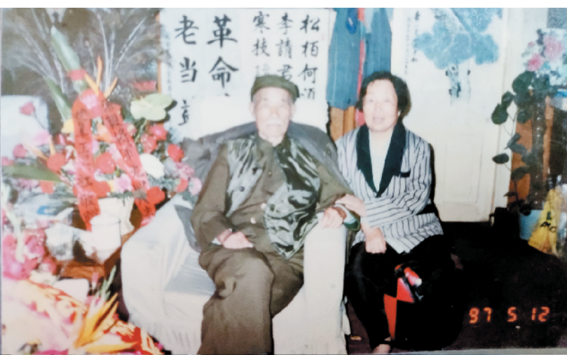
1997年,孙毅将军与王广建的女儿王素芹合影。

王广建,河南省沈丘县人,1898年生。1918年参加冯玉祥西北军,同年考入保定军官学校,逐步升为排长、连长、营长、团长,后编入国民革命军第二十六路军。1931年宁都起义时,任第二十六路军起义委员会总指挥。参加红军后编入红五军团,任第十三军三十九师师长。1933年,第四次反“围剿”战争时牺牲,1976年被追认为革命烈士。沈丘县烈士陵园有其墓葬及名录。事迹收录于《中国工农红军第一方面军人物志》《雄师铁军——宁都起义将士录》等。