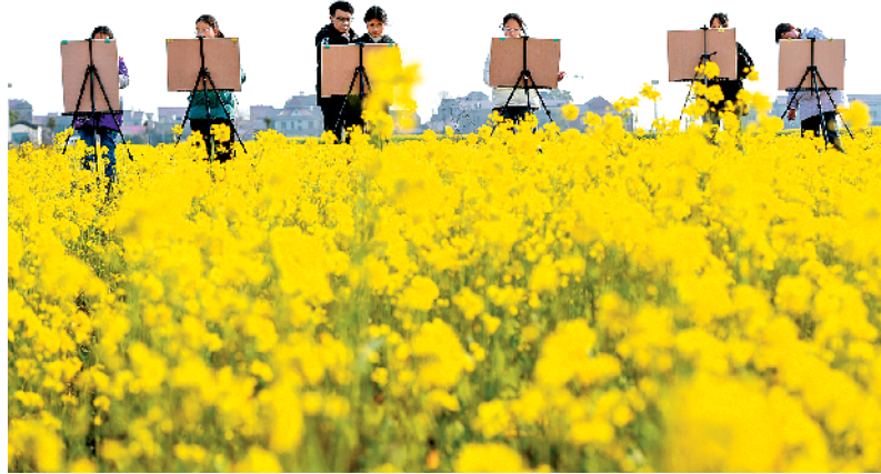
2月21日,一群学生在江西省樟树市永泰镇官湖村油菜花海中写生。随着天气回暖,江西省樟树市永泰镇官湖村的油菜花竞相绽放,金黄色花海染尽乡野,吸引了众多游人和学生等前来观赏、写生,感受春日之美。