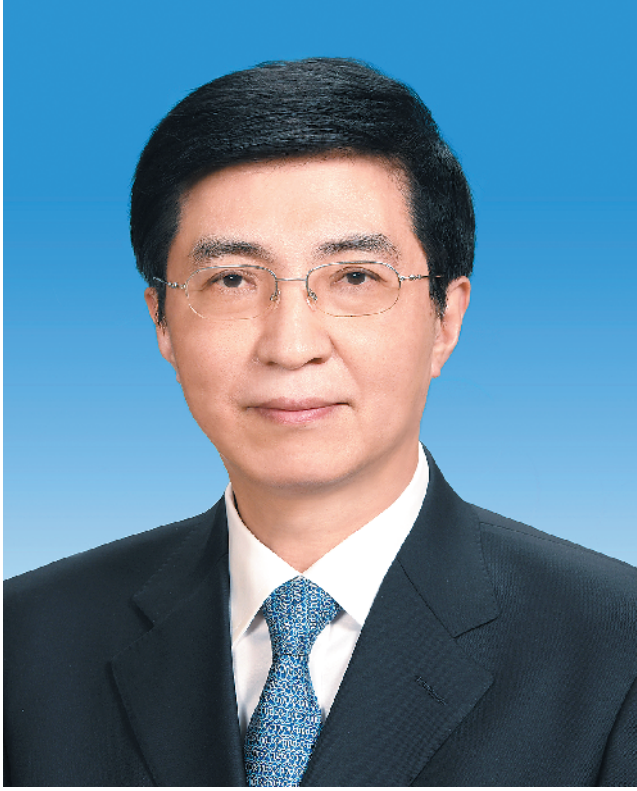
中国人民政治协商会议第十四届全国委员会主席 王沪宁

现任中共二十届中央政治局常委,十四届全国人大常委会委员长。 (新华社北京3月10日电)