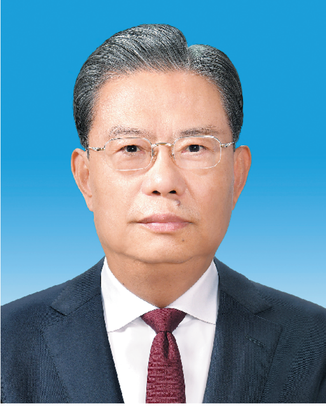
第十四届全国人民代表大会常务委员会委员长 赵乐际

中华人民共和国第十四届全国人民代表大会第一次会议主席团 2023年3月10日于北京 (新华社北京3月10日电)