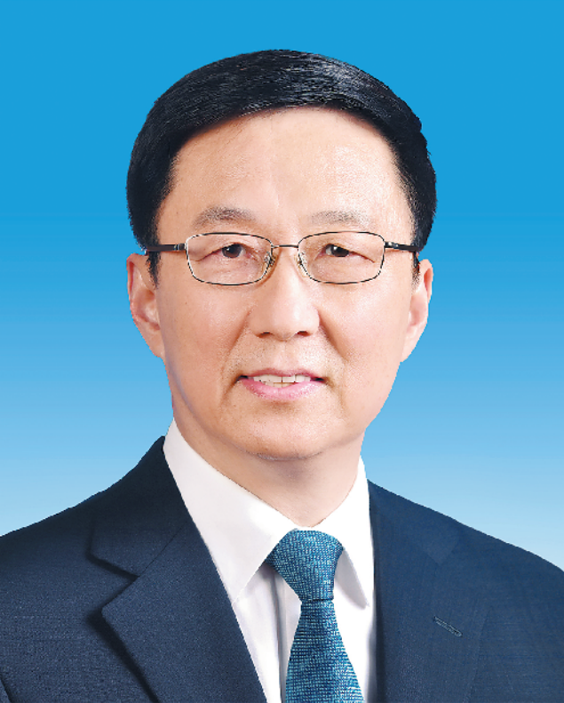
中华人民共和国副主席 韩正

现任中共二十届中央政治局常委,十四届全国政协主席,中央全面深化改革委员会办公室主任。 (新华社北京3月10日电)