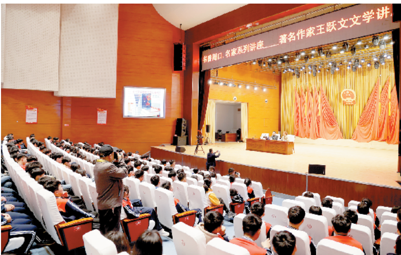
王跃文文学讲座现场。

“道德名城,魅力周口”的历史正在被书写,“书香周口、文化周口”的氛围日渐浓郁。①6