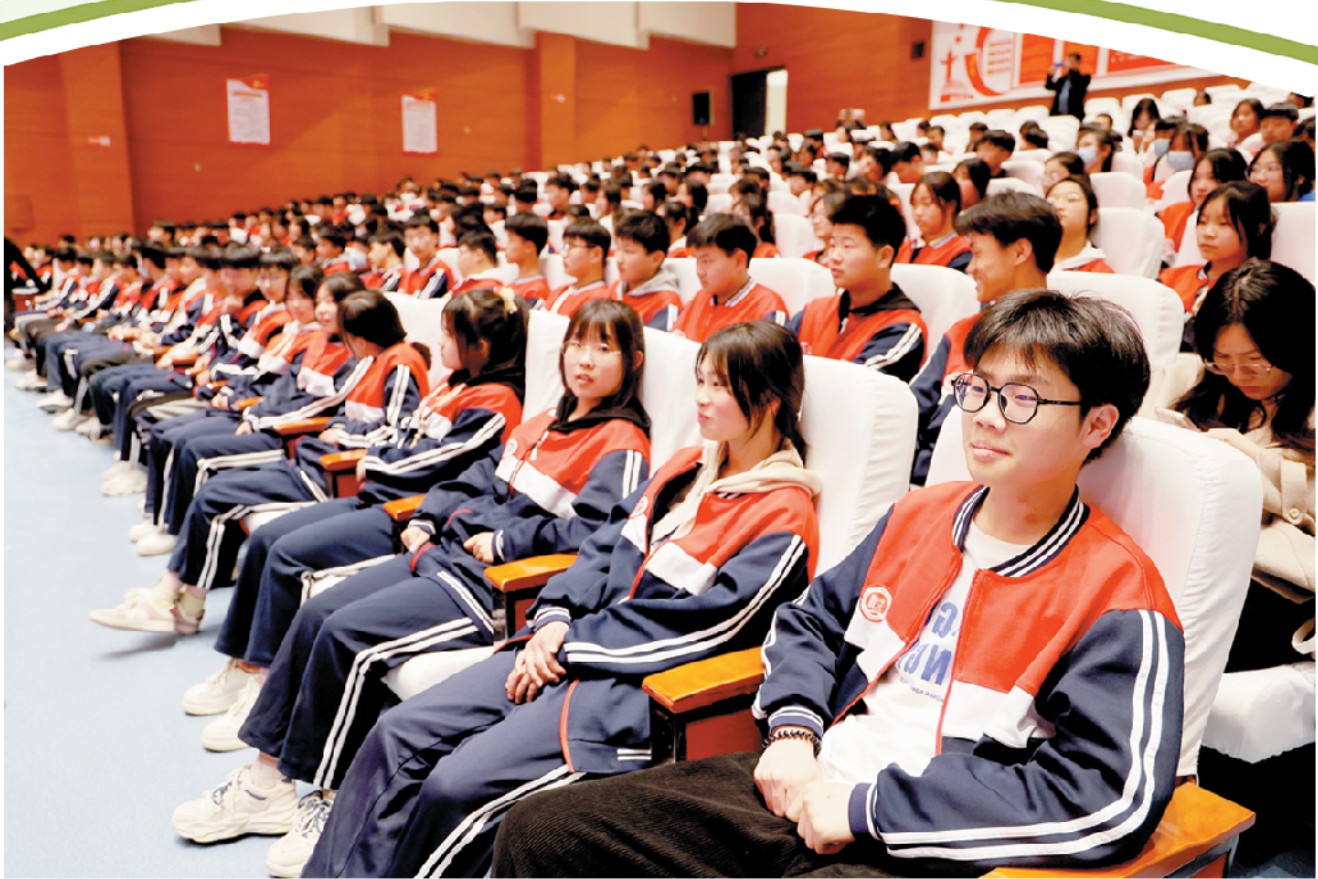
周口学子在认真听王跃文讲座。