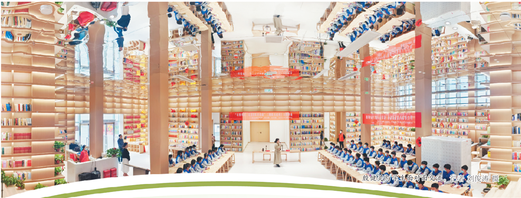
殷健灵与学生面对面交流。记者 刘俊涛 摄