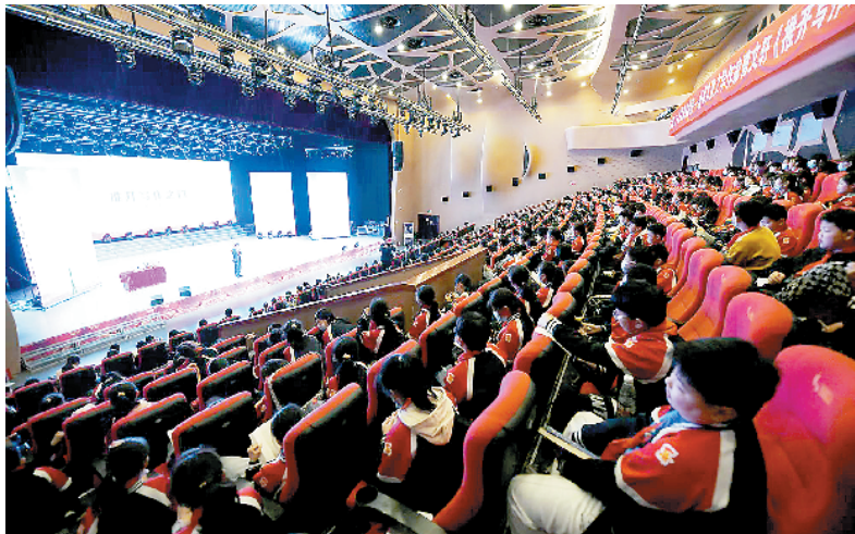
曹文轩讲座座无虚席。