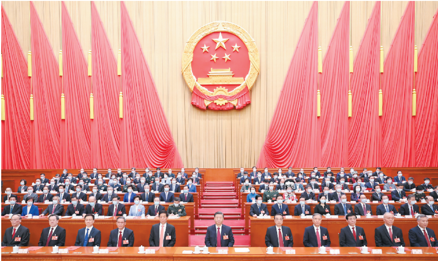
3月13日,第十四届全国人民代表大会第一次会议在北京人民大会堂闭幕。习近平等党和国家领导人在主席台就座。

新华社北京3月13日电 中华人民共和国第十四届全国人民代表大会第一次会议,在圆满完成各项议程,产生新一届国家机构组成人员后,13日上午在北京人民大会堂闭幕。