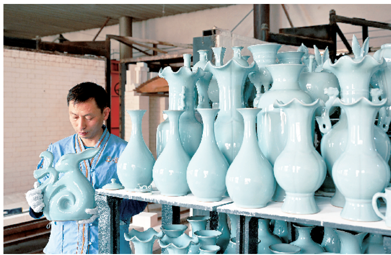
河南汝州:做强汝瓷产业 擦亮汝瓷“名片”

文章指出,必须坚持问题导向和系统观念,着力破除制约加快构建新发展格局的主要矛盾和问题,全面深化改革,推进实践创新、制度创新,不断扬优势、补短板、强弱项。第一,更好统筹扩大内需和深化供给侧结构性改革,增强国内大循环动力和可靠性。要把扩大内需战略同深化供给侧结构性改革有机结合起来,供需两端同时发力、协调配合,形成需求牵引供给、供给创造需求的更高水平动态平衡,实现国民经济良性循环。第二,加快科技自立自强步伐,解决外国“卡脖子”问题。第三,加快建设现代化产业体系,夯实新发展格局的产业基础。第四,全面推进城乡、区域协调发展,提高国内大循环的覆盖面。有了实现了城乡、区域协调发展,国内大循环的空间才能更广阔、成色才能更足。第五,进一步深化改革开放,增强国内外大循环的动力和活力。