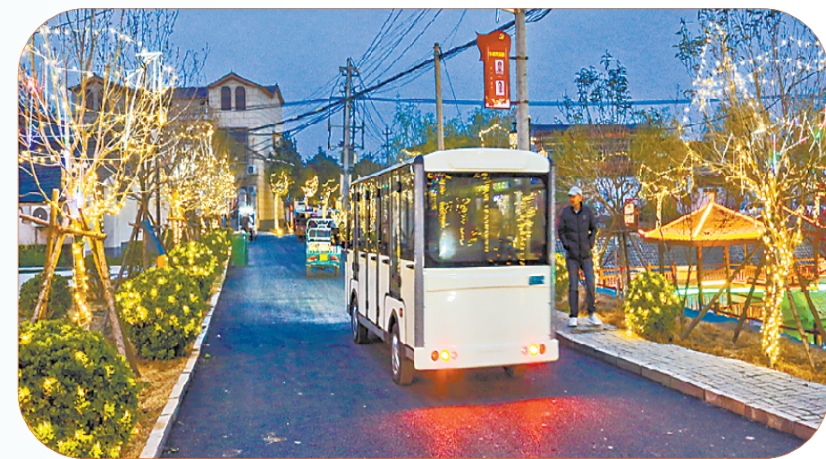
璀璨夜景 点亮桃乡