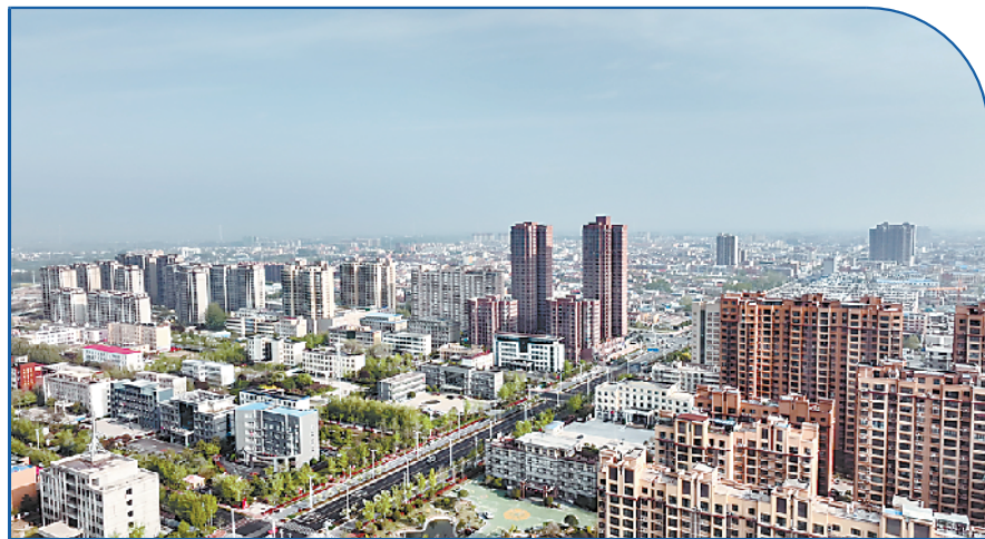
高楼林立 安居乐业

“新头路”打通了,地下管网顺畅了,大街小巷变亮了,城市“颜值”提升了,基础设施完善了,乡村美景展现了,工业经济更强了……短短一年多时间,西华全县上下拧成一股绳、劲往一处使,一路披荆斩棘,一路凯歌高歌,经济社会取得具有里程碑意义的非凡成就,千古郟城焕发出新的风姿,百万西华人民有了更多的获得感和幸福感。③11