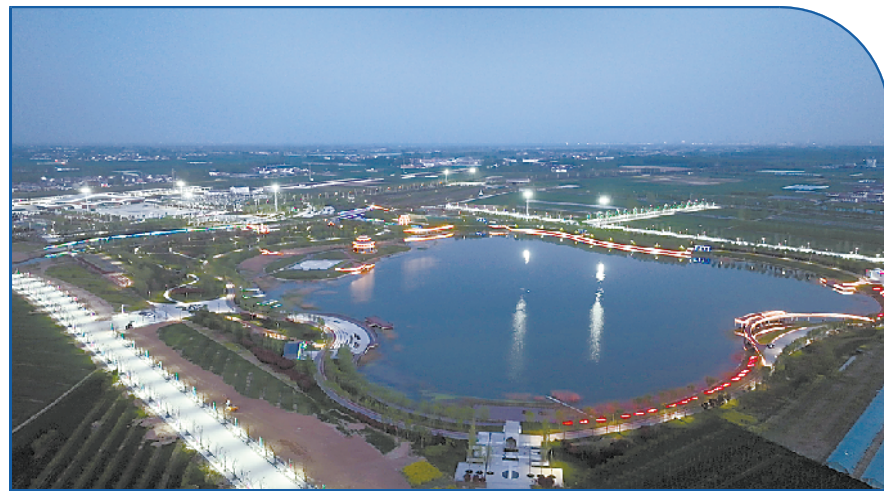
湖光楼影 夜色斑斓