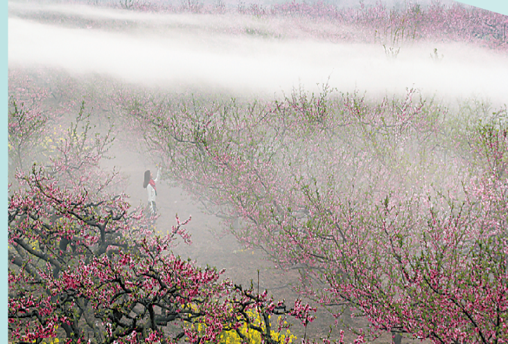
桃源仙境 如梦如幻