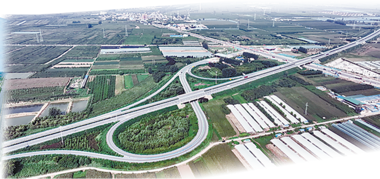
内联外通 四通八达