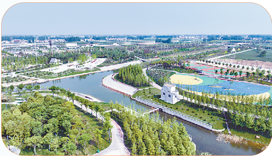
新区新貌 宜业宜居