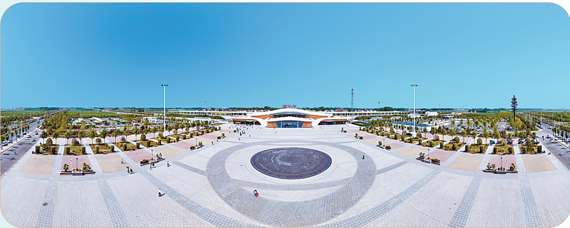
交通便利 联通八方