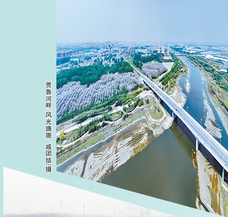
贾鲁河畔 风光旖旎