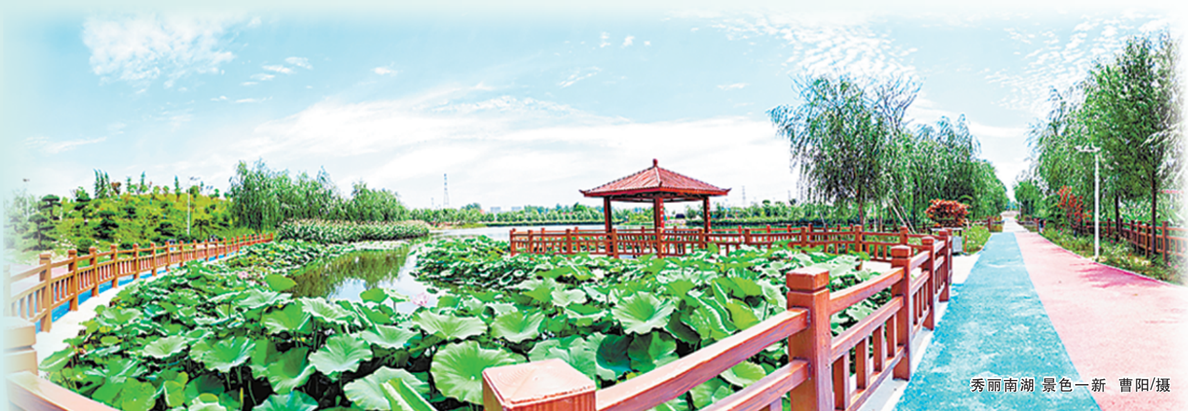
秀丽南湖 景色一新