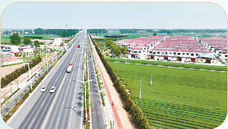
快速通道 串联两城