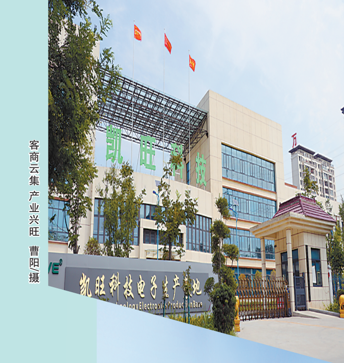
客商云集 产业兴旺