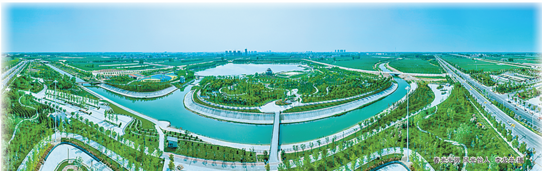
春光无限 风景宜人