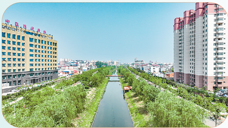
东风运河 河清水畅