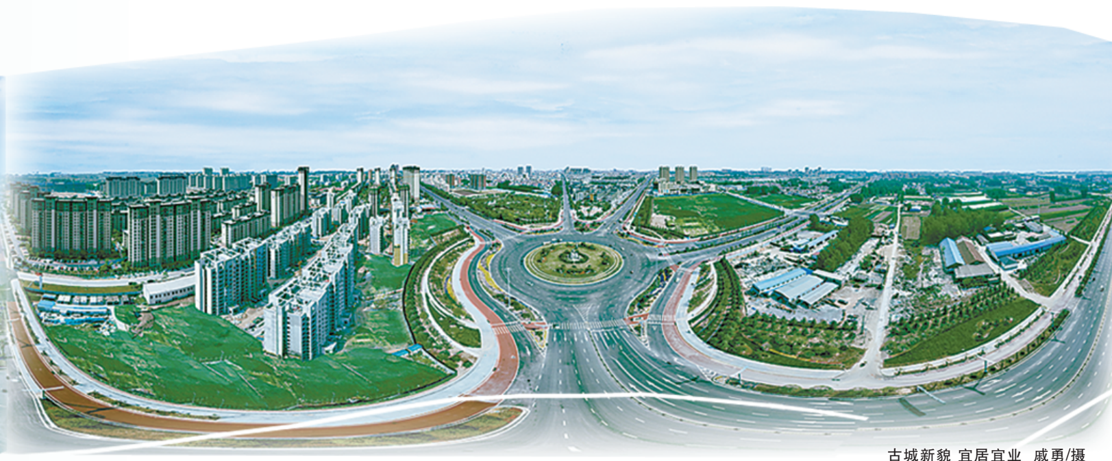
古城新貌 宜居宜业