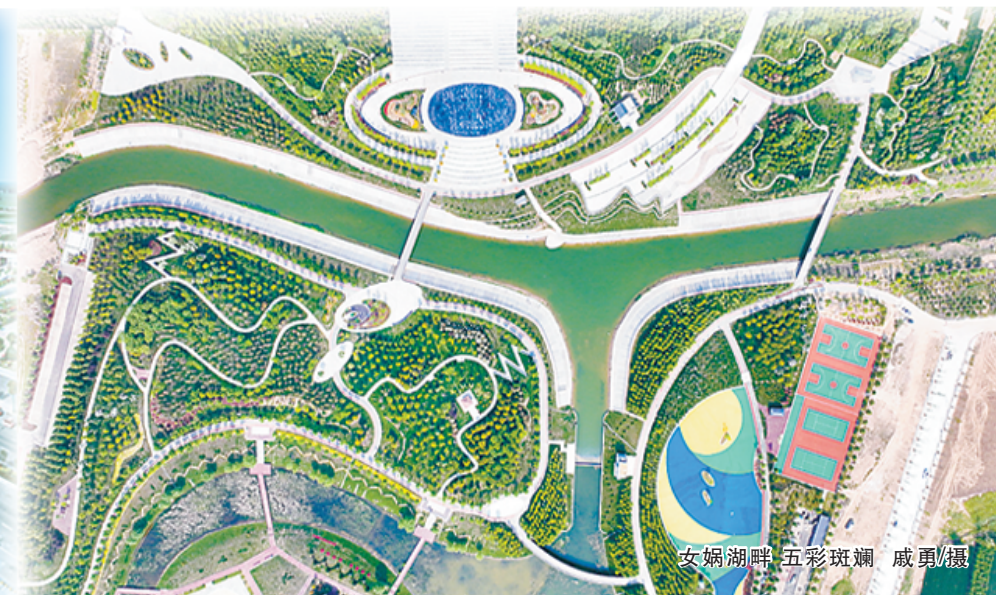
女娲湖畔 五彩斑斓