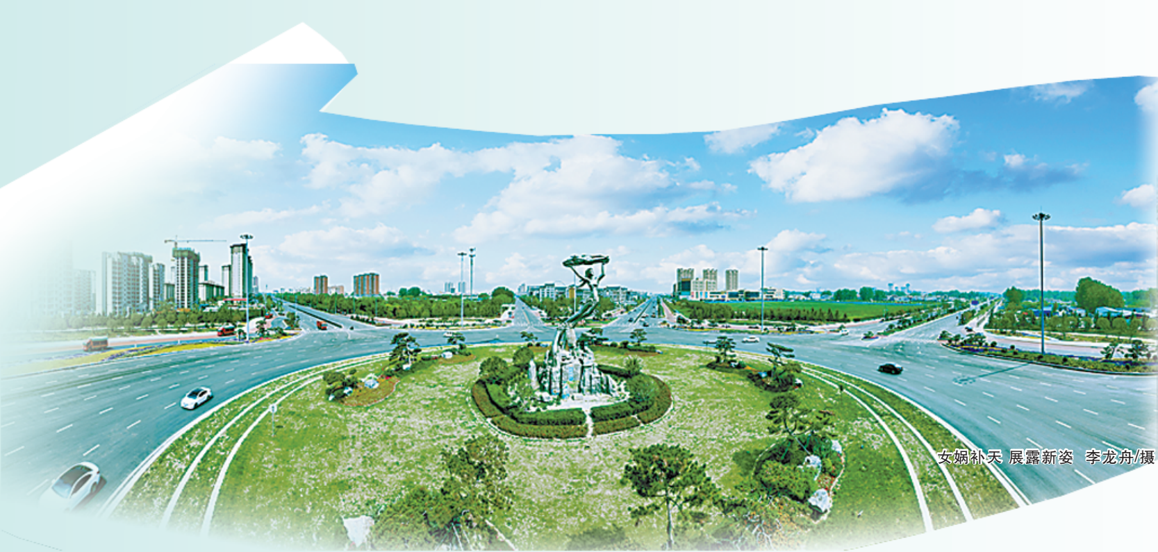
衣领补天 展露新姿

为展示西华县取得的巨大发展成果,2023年2月28日,由周口日报社、西华县委宣传部主办,西华县城镇建设投资有限公司、周口日报社驻西华记者站承办的“西华城投杯·周口后花园 靓丽新西华”主题摄影大赛正式启动。活动开展以来,广大摄影爱好者踊跃参赛,拍摄了大量反映西华城市蝶变的摄影作品,现将部分作品进行展示。