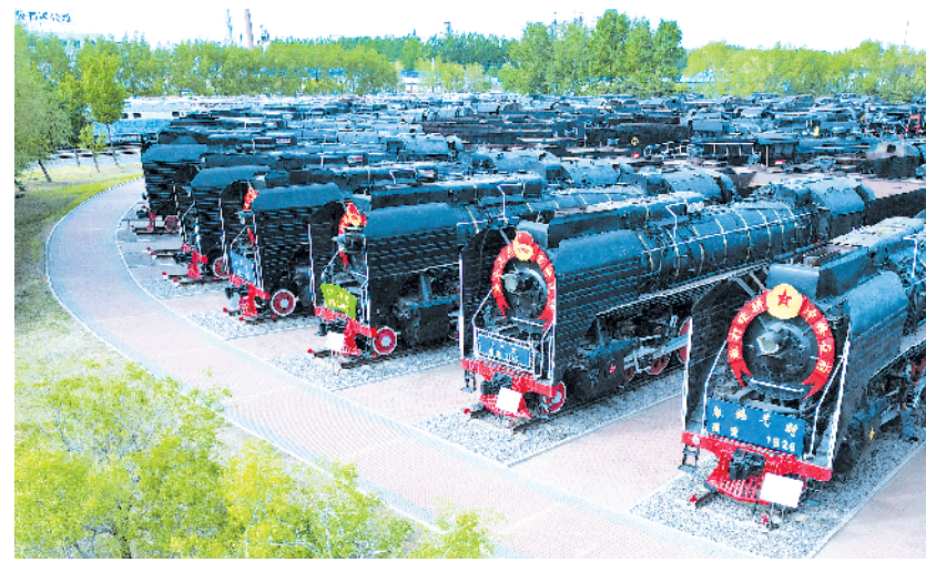
火车头上的岁月变迁——走进大安北蒸汽机车陈列馆

为促进中国同中亚五国贸易畅通,当前,海关部门积极推动我国与中亚毗邻国家公路口岸恢复客货运输常态化运行,进一步推广国际贸易“单一窗口”和“经认证的经营者”(AEO)互认合作。此外,为促进农食产品贸易发展,海关还积极推动中亚国家粮食、水果、油料、乳品、畜牧产品等优质农食产品输华,持续扩大农副产品快速通关“绿色通道”。