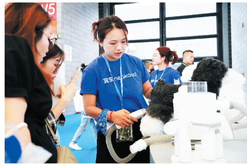
第25届亚洲宠物展在沪开幕

从同比看,7月份,一、二线城市新建商品住宅销售价格同比分别上涨1%和0.2%,涨幅比上月均回落0.3个百分点;三线城市新建商品住宅销售价格同比下降1.5%,降幅比上月扩大0.1个百分点。7月份,一、二、三线城市二手住宅销售价格同比分别下降1.4%、2.7%和3.5%,降幅比上月分别扩大1.0、0.3和0.1个百分点。