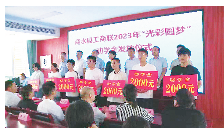
8月23日,商水县工商联、县红十字会在商水一高举办“光彩圆梦”助学会发放仪式。

指数、推动乡村振兴的重要举措,各村要提高政治站位,扛稳创建责任,动员各方力量,整合各类资源,常态化开展人居环境整治工作,切实增强群众的幸福感和获得感。