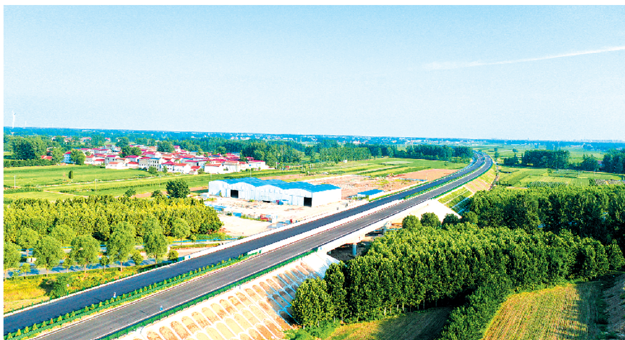
濮新高速郸城县钱店镇附近鸟瞰图。