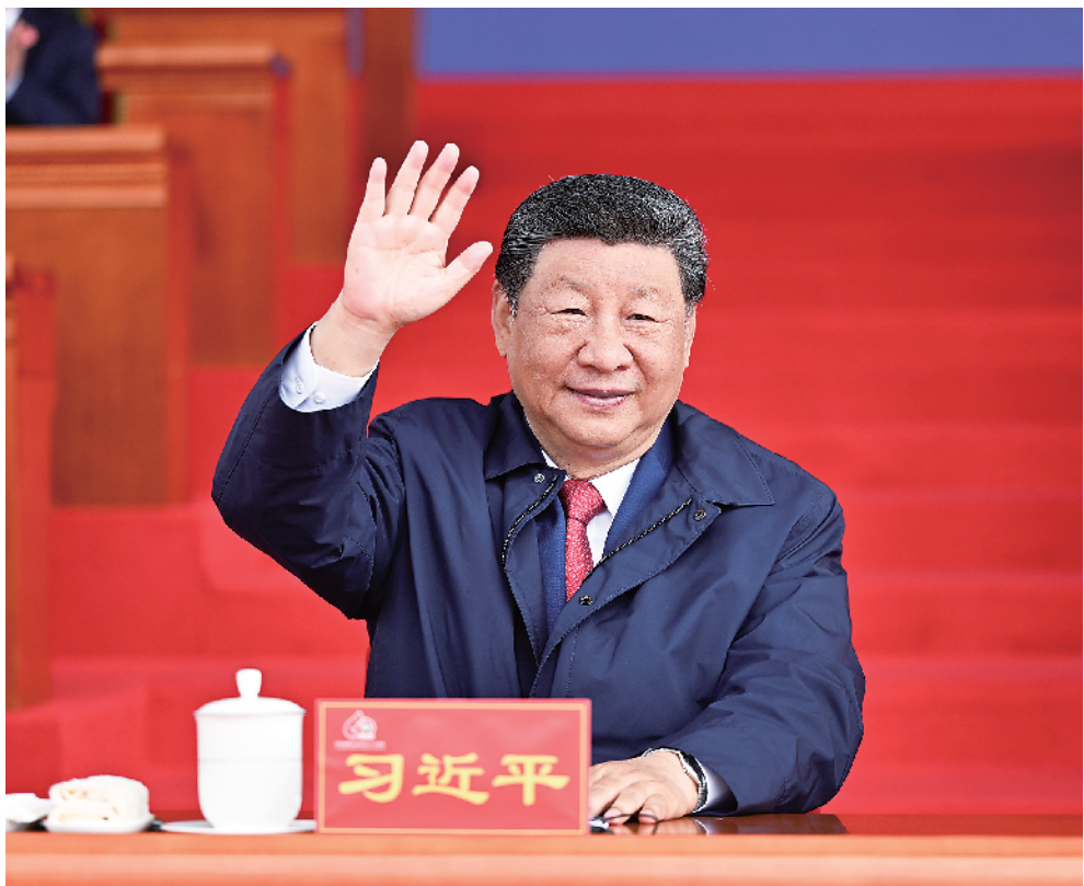
8 月 21 日上午,西藏各族各界干部群众约 2 万人欢聚拉萨市布达拉宫广场,热烈庆祝西藏自治区成立 60 周年。中共中央总书记、国家主席、中央军委主席习近平出席庆祝大会。